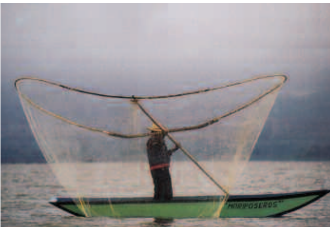
Pescador del Lago de Zirahuén, Michoacán.

La iniciativa de la Carta de la Tierra ha entrado en una nueva fase, la cual se centra en llevar estos principios a la acción. Para ello, el gobierno mexicano declaró su apoyo durante la Cumbre Mundial de Desarrollo Sustentable, celebrada en Johannesburgo, Sudáfrica, para lo cual México constituye el Comité Nacional para la Carta de la Tierra operado por un Secretariado Nacional, con el propósito de cristalizar los objetivos de la Alianza Tipo II, "Educando para un Estilo de Vida Sostenible con la Carta de la Tierra".