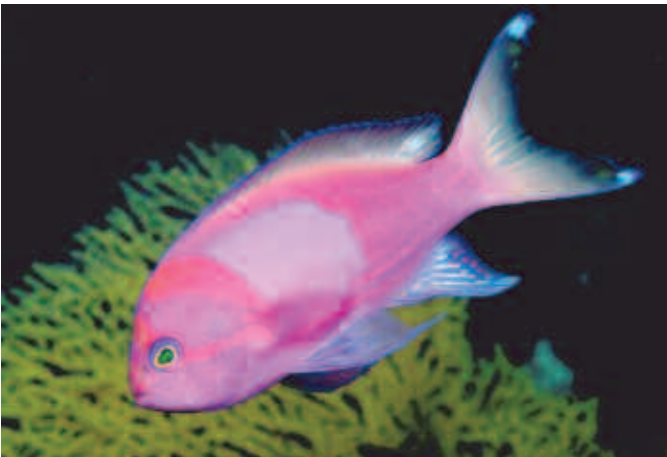
Fauna en el arrecife de Cozumel, Quintana Roo.