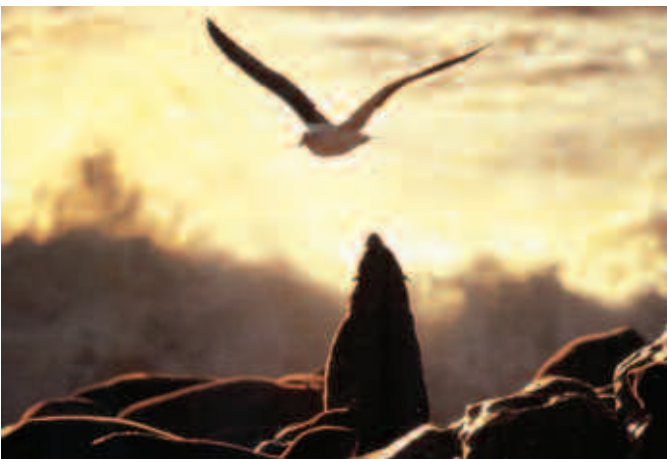
Lobo marino, Baja California Sur.