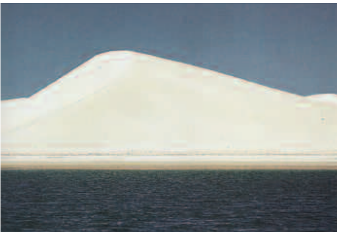
Mar de Cortés, Baja California Sur.