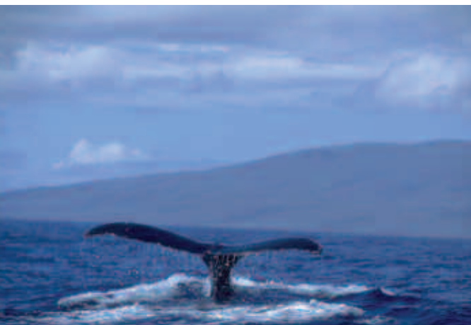
Ballena jorobada, Baja California Sur.

Necesitamos urgentemente una visión compartida sobre los valores básicos que brinden un fundamento ético para la comunidad mundial emergente. Por lo tanto, juntos y con una gran esperanza, afirmamos los siguientes principios interdependientes, para una forma de vida sostenible, como un fundamento común mediante el cual se deberá guiar y valorar la conducta de la gente, organizaciones, empresas, gobiernos e instituciones transnacionales.