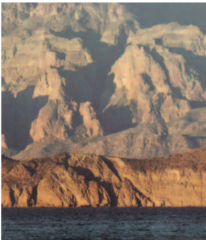
Isla Danzante, Golfo de California.

Estamos en un momento crítico de la historia de la Tierra, en el cual la humanidad debe elegir su futuro. A medida que el mundo se vuelve cada vez más interdependiente y frágil, el futuro depara, a la vez, grandes riesgos y grandes promesas. Para seguir adelante debemos reconocer que en medio de la magnífica diversidad de culturas y formas de vida, somos una sola familia humana y una sola comunidad terrestre con un destino común. Debemos unirnos para crear una sociedad global sostenible, fundada en el respeto hacia la naturaleza, los derechos humanos universales, la justicia económica y una cultura de paz. En torno a este fin, es imperativo que nosotros, los pueblos de la Tierra, declaremos nuestra responsabilidad unos hacia otros, hacia la gran comunidad de la vida y hacia las generaciones futuras.