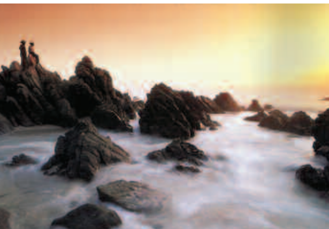
Puerto Escondido, Oaxaca.

La Carta de la Tierra nos reta a examinar nuestros valores y a escoger un mejor camino. Nos hace un llamado a buscar un terreno común dentro de nuestra diversidad y a elegir una nueva visión ética compartida.