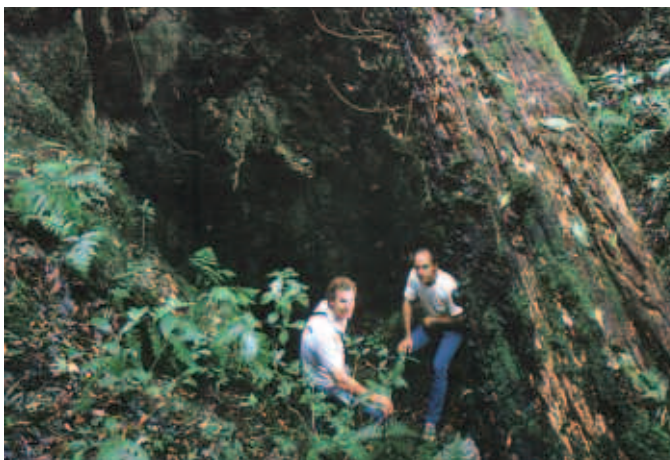
Reserva de la biosfera El Cielo, Tamaulipas.

Instrumento de ley blanda que proporcione una base ética para el establecimiento progresivo de normas jurídicas ambientales y del desarrollo sostenible.