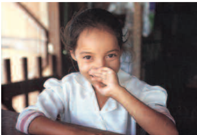
Niña de Río Hondo, Quintana Roo.