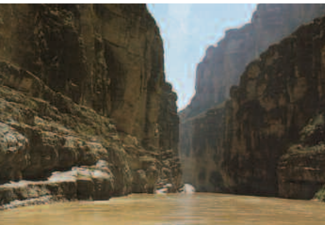
Río Bravo, Chihuahua.

Los patrones dominantes de producción y consumo están causando devastación ambiental, agotamiento de recursos y una extinción masiva de especies. Las comunidades están siendo destruidas. Los beneficios del desarrollo no se comparten equitativamente y la brecha entre ricos y pobres se está ensanchando. La injusticia, la pobreza, la ignorancia y los conflictos violentos se manifiestan por doquier y son la causa de grandes sufrimientos. Un aumento sin precedentes de la población humana ha