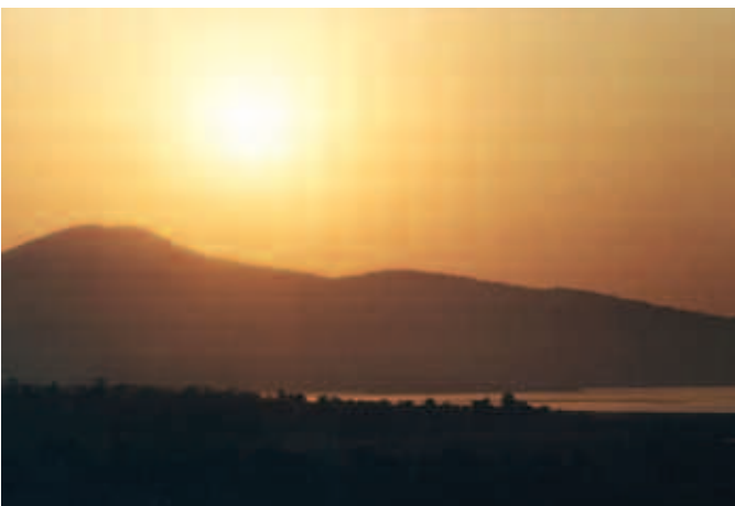
Amanecer en Pátzcuaro, Michoacán.