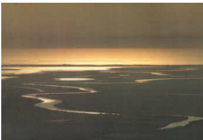
Amanecer sobre el Río Bravo, Tamaulipas.

La Carta de la Tierra es el producto de conversaciones interculturales llevadas a cabo en el ámbito mundial durante una década, con respecto a metas comunes y valores compartidos.