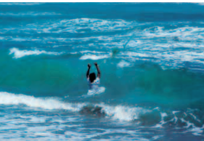
Pescador de Playa Azul, Michoacán.