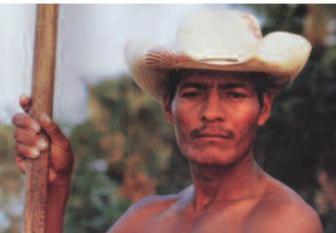
Campesino de La Chontalpa, Tabasco.