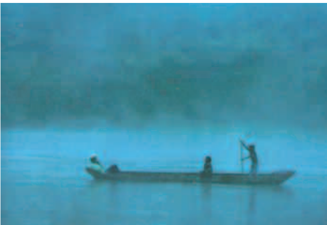
Río Usumacinta, Chiapas.