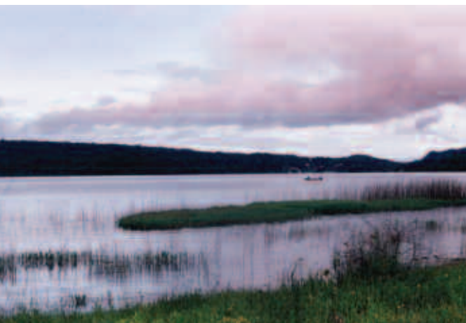
Lago de Zirahuén, Michoacán.