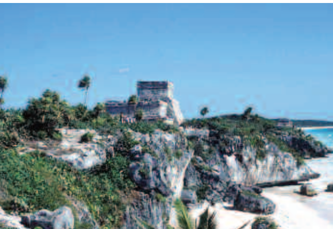
Ruinas de Tulum, Quintana Roo.

Para poder realizar estos cuatro compromisos generales es necesario: