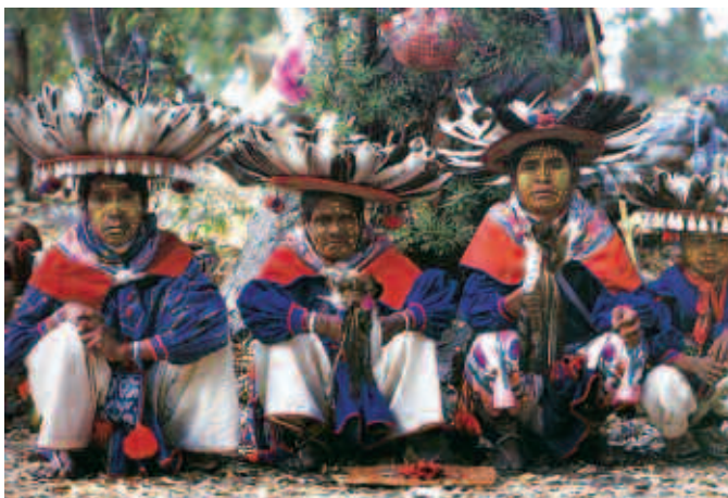
Huicholes, San Luis Potosí.

En 1997 se formó una Comisión de la Carta de la Tierra con el fin de supervisar el proyecto y la redacción de este documento. En ese mismo año, durante la conclusión del Foro de Río+5, celebrado también en Río de Janeiro, la Comisión de la Carta de la Tierra