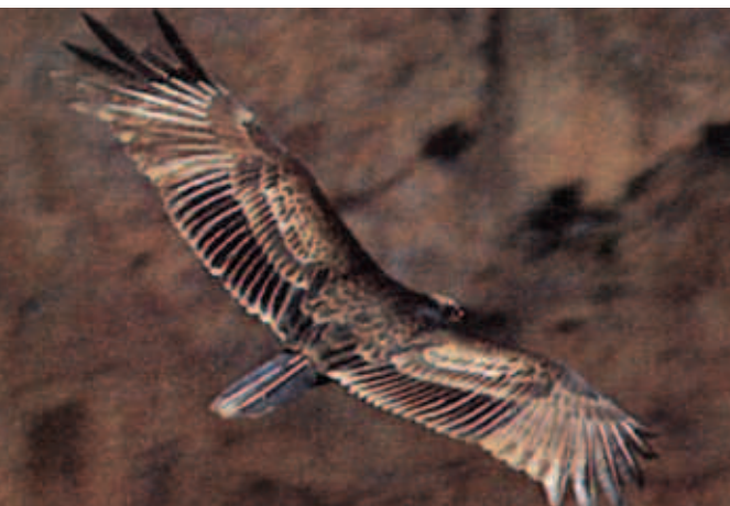
Zopilote sobre el Cañón Mariscal, Chihuahua.