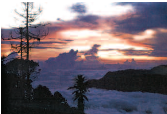
Crepúsculo en la Sierra de Guerrero.

Para realizar estas aspiraciones debemos tomar la decisión de vivir de acuerdo con un sentido de responsabilidad universal, identificándonos con toda la