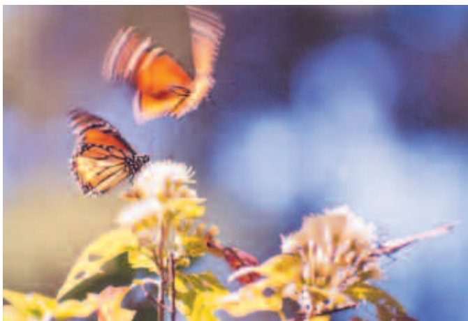
Mariposa monarca, Estado de México.

El proceso requerirá un cambio de mentalidad y de corazón; requiere también un nuevo sentido de interdependencia global y responsabilidad universal. Debemos elaborar y aplicar imaginativamente la visión de un modo de vida sostenible a escala local, nacional, regional y global. Nuestra diversidad cultural es una herencia preciosa y las diferentes culturas encontrarán sus propias formas para concretar lo establecido. Debemos profundizar y ampliar el diálogo global que generó la Carta de la Tierra, puesto que tenemos mucho que aprender en la búsqueda colaboradora de la verdad y la sabiduría.