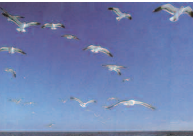
Gaviotas, Baja California.

Miles de individuos y cientos de organizaciones provenientes de todas las regiones del mundo, de diferentes culturas y de diversos sectores de la sociedad, han participado en este proceso. Tanto expertos como representantes de las comunidades de base han ido moldeando la Carta de la Tierra. El documento representa un tratado de los pueblos, el cual se establece como expresión primordial de las esperanzas y aspiraciones provenientes de la sociedad civil global emer-