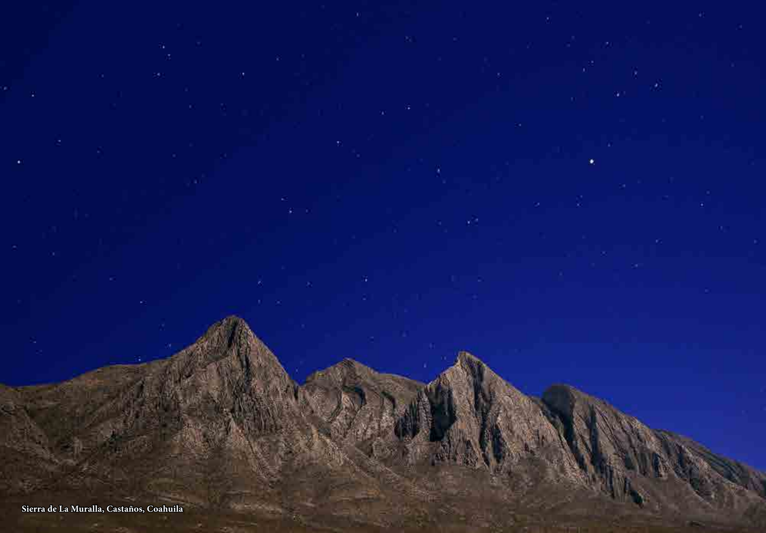
Sierra de La Muralla, Castaños, Coahuila