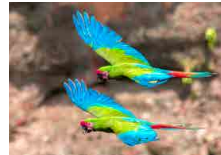
Guacamaya Militar, Tecomavaca, Oaxaca