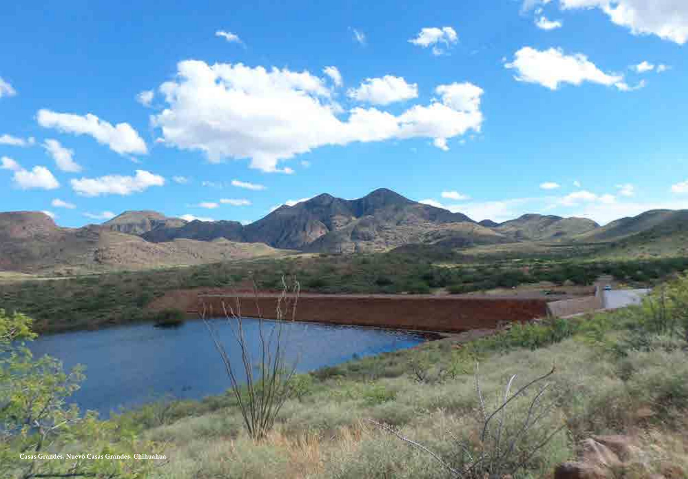
Casas Grandes, Nuevo Casas Grandes, Chihuahua