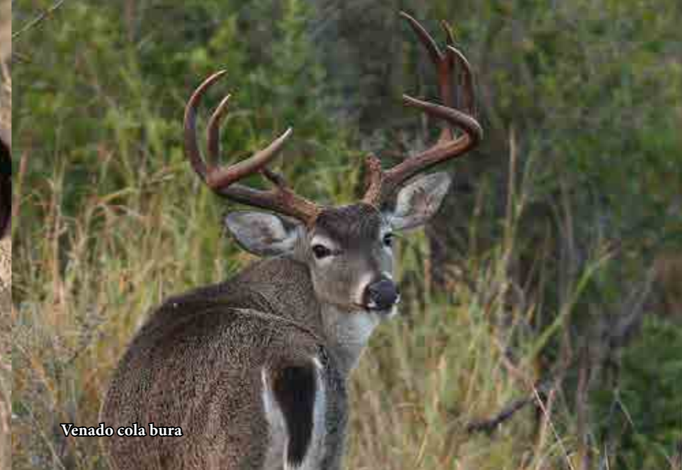
Venado cola bura