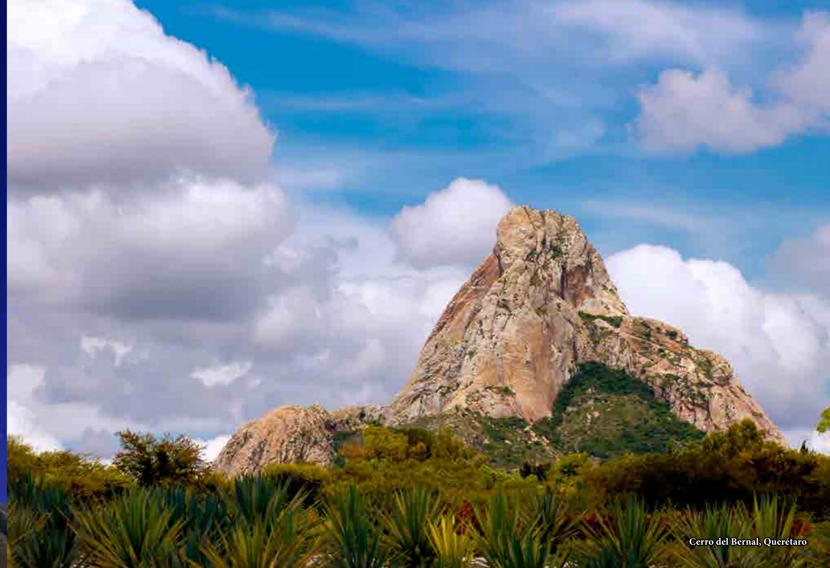
Cerro del Bernal, Querétaro