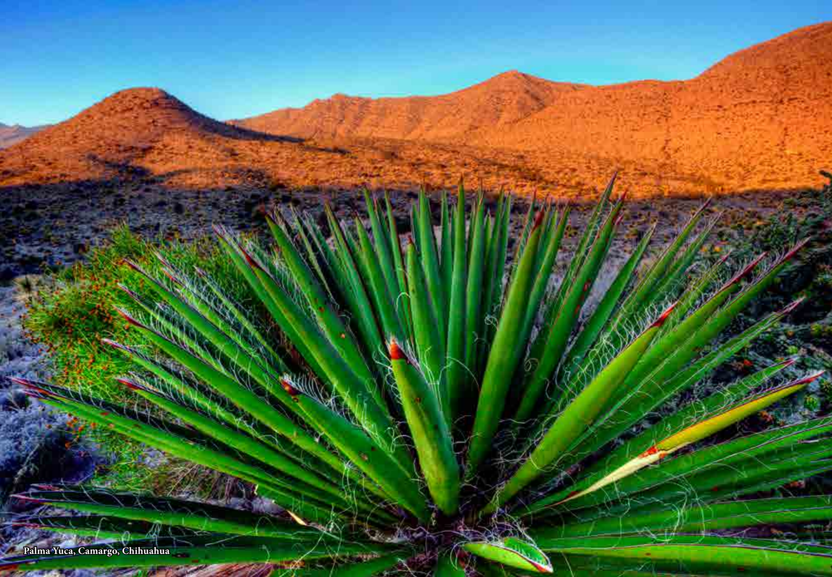
Palma Yuca, Camargo, Chihuahua