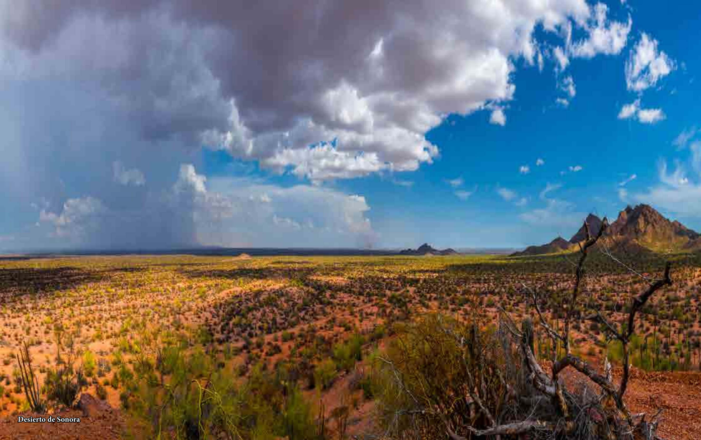
Desierto de Sonora