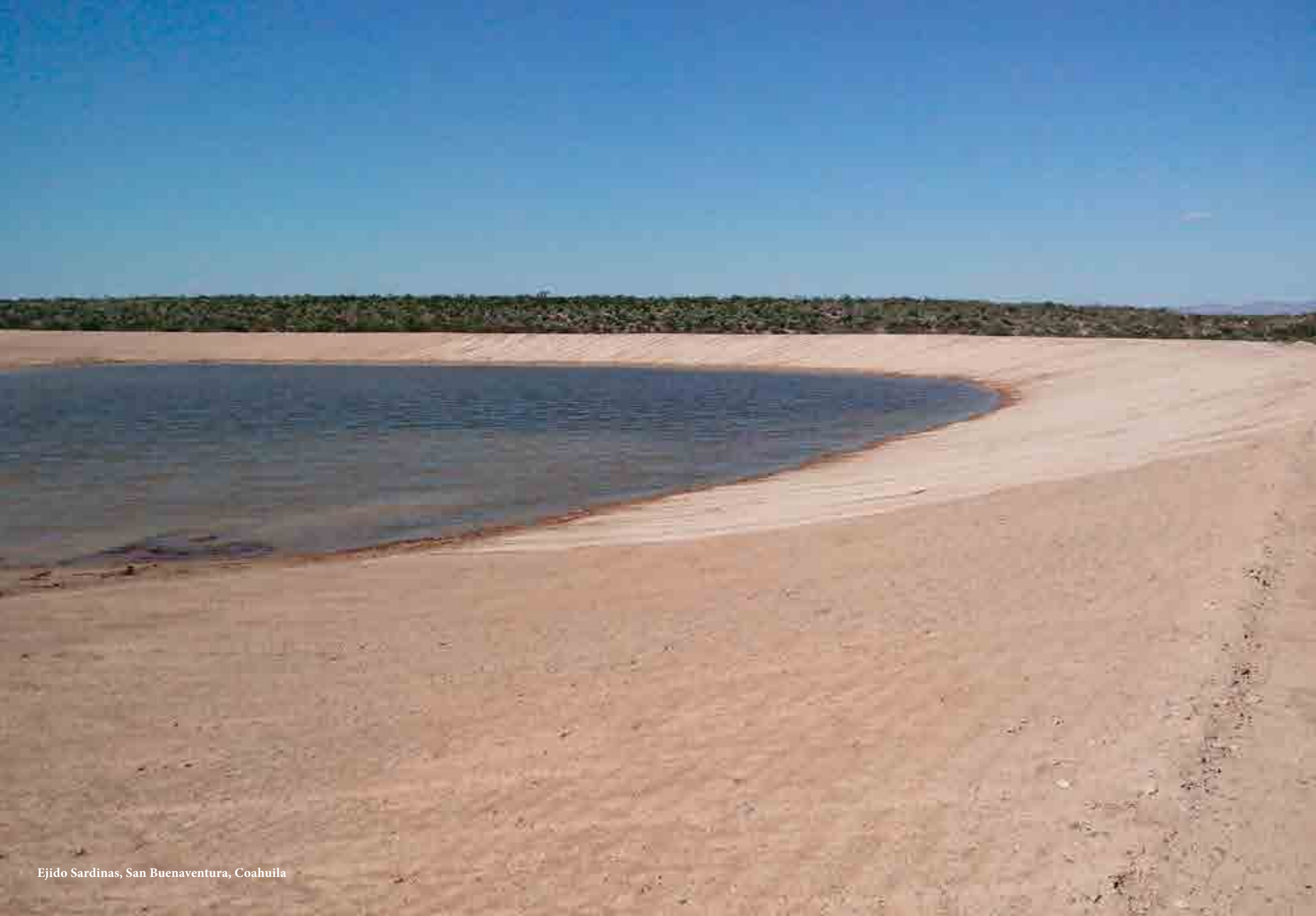
Ejido Sardinas, San Buenaventura, Coahuila