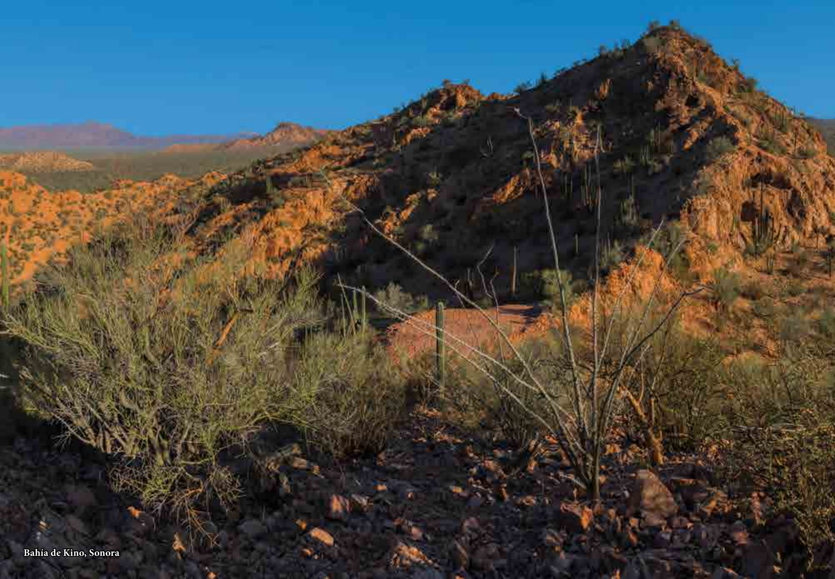
Bahía de Kino, Sonora