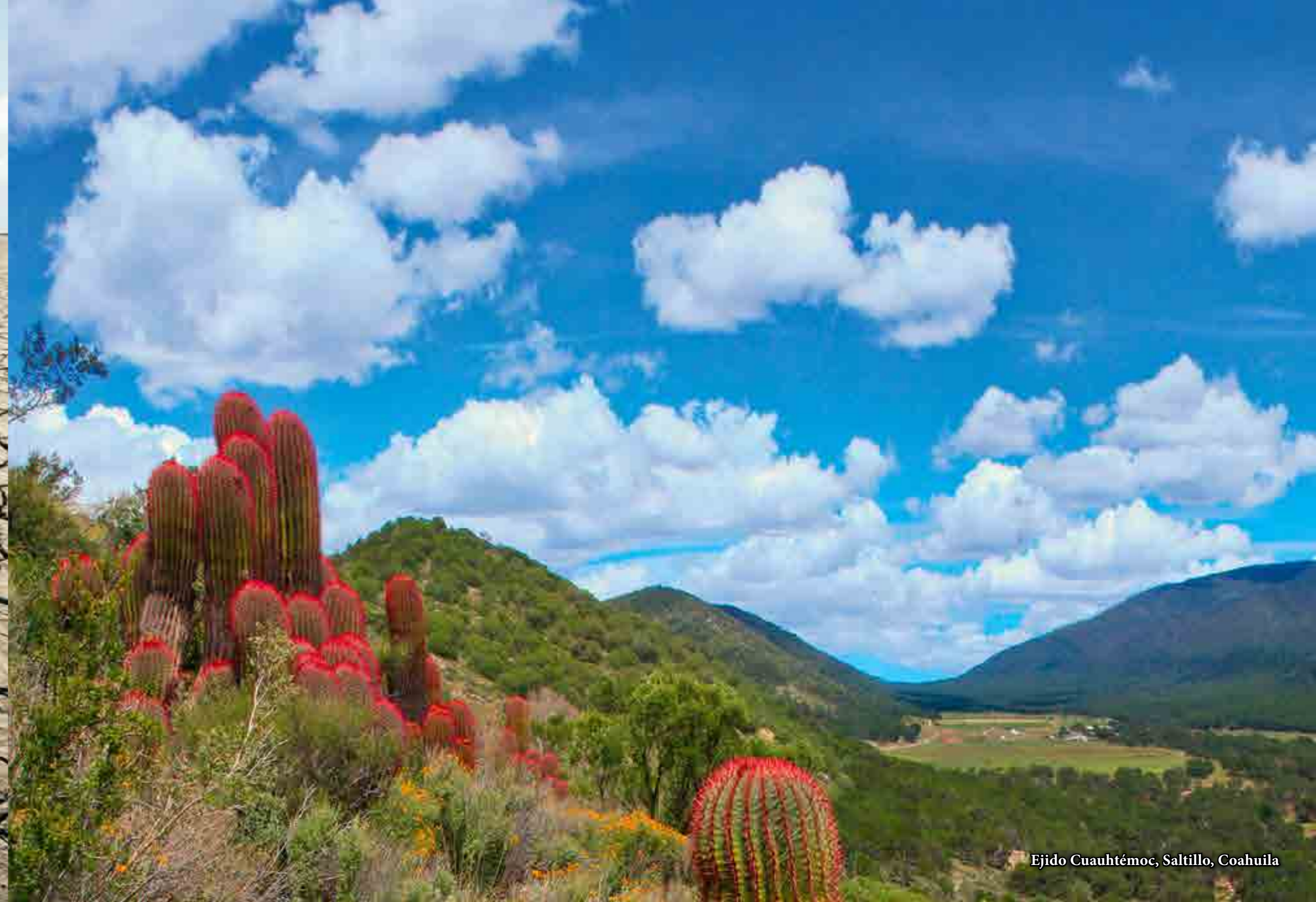
Ejido Cuauhtémoc, Saltillo, Coahuila