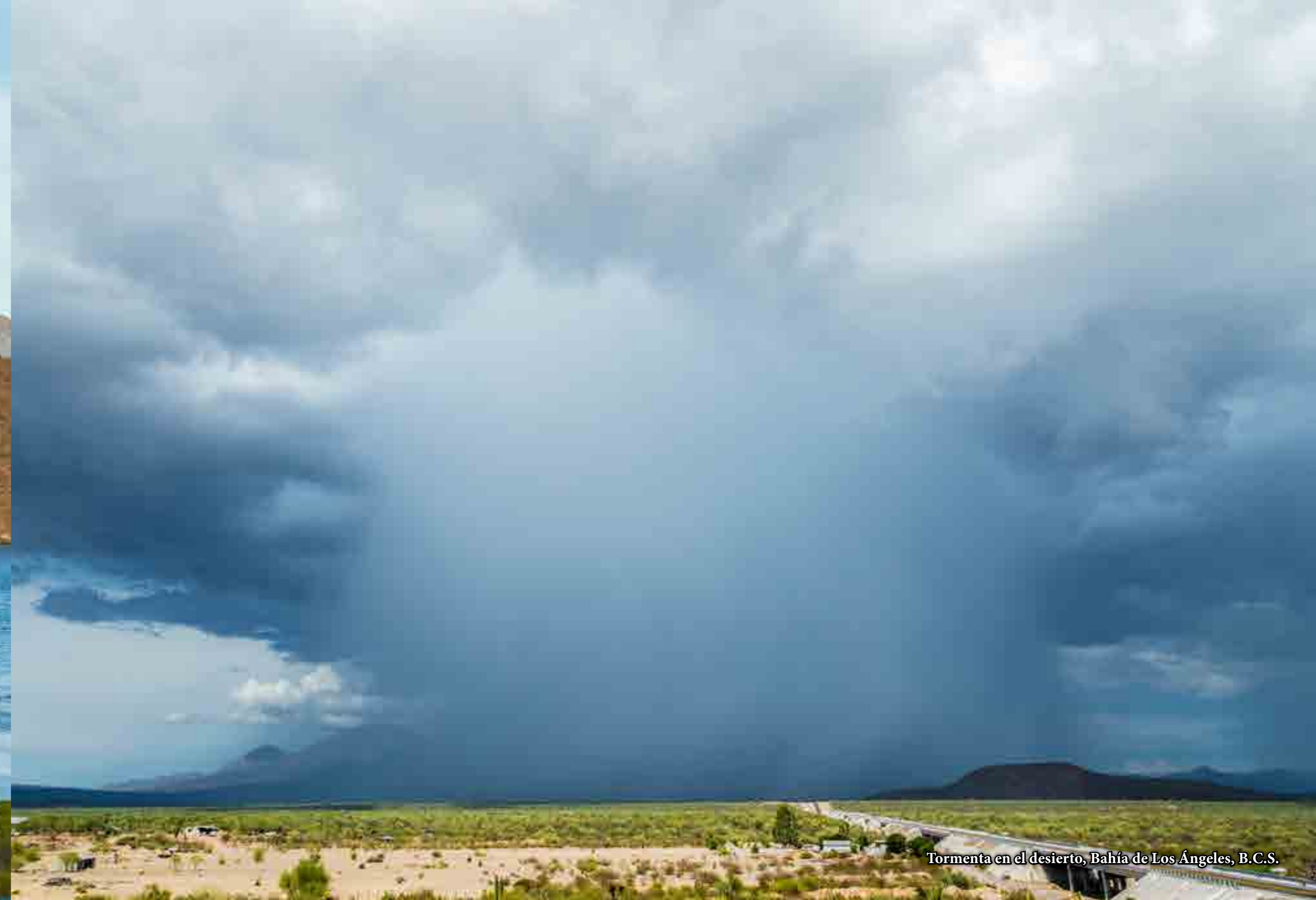
Tormenta en el desierto, Bahía de Los Angeles, B.C.S.