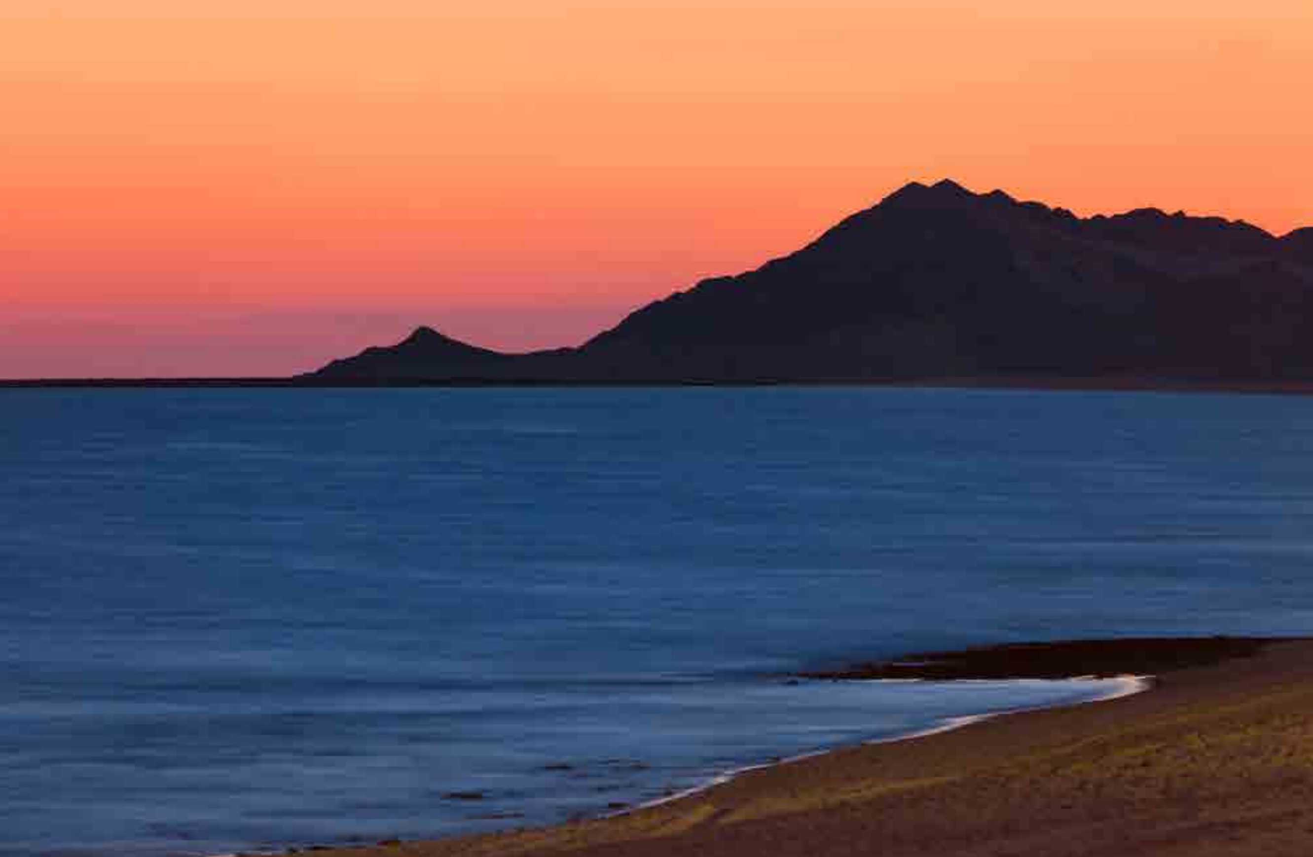
Puerto Peñasco, Sonora