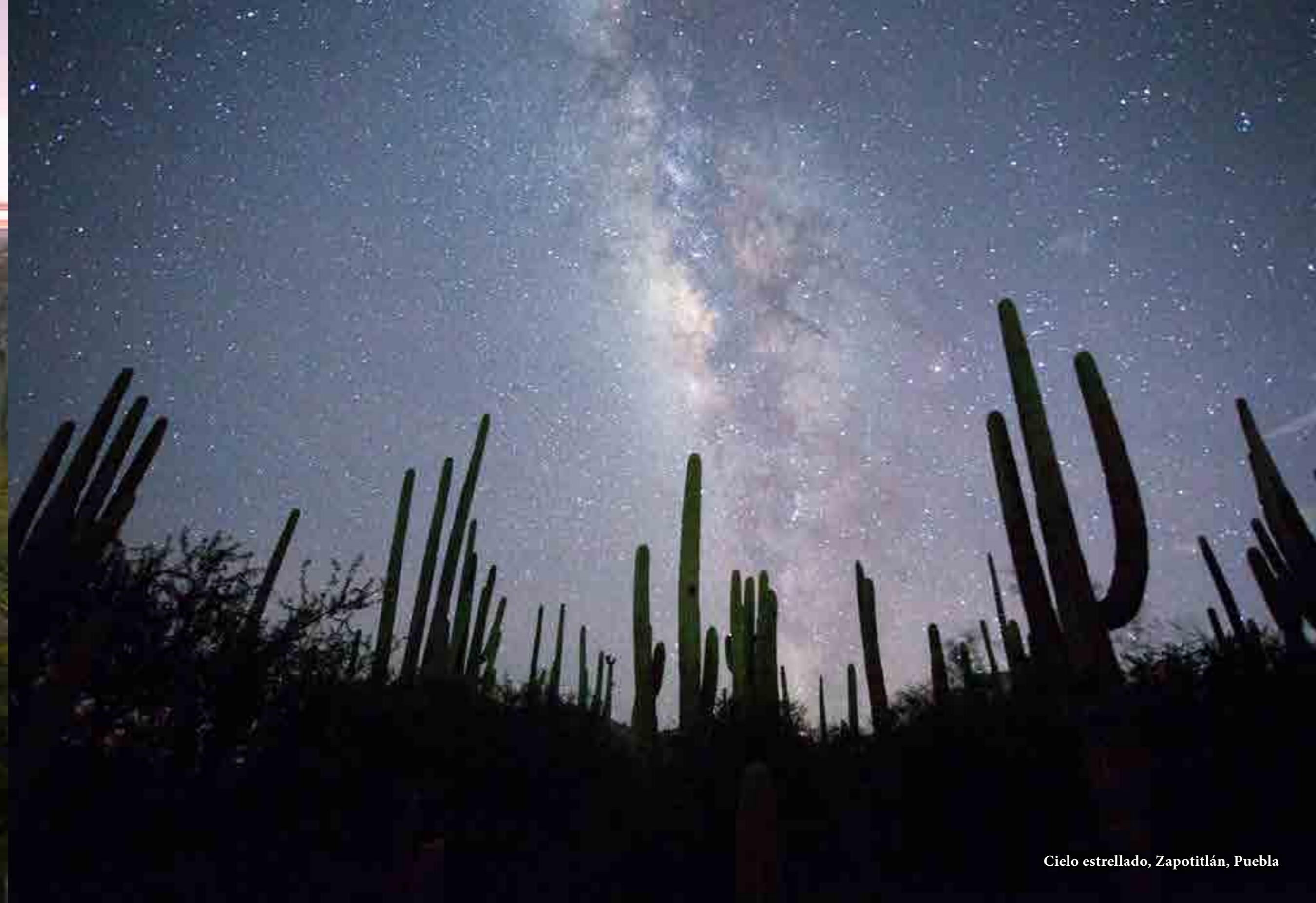
Cielo estrellado, Zapotitlán, Puebla