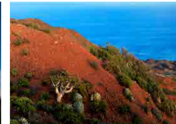
Isla Cedros, Baja California

El Desierto de Baja California abarca 77,700 km 2 y se divide en: El Distrito del Desierto del Colorado que cubre la parte Noreste de Baja California, hasta la Bahía de Los Angeles donde el agua es extremadamente escasa. El Distrito del Desierto de Vizcaíno ocupa la parte central de la Península cuya extensión incluye las mesetas graníticas características de la zona y la planicie volcánica. Presenta una transición de los chaparrales en el desierto de Baja California y los bosques de California. El clima es seco y subtropical. Aunque las lluvias son escasas, el Océano Pacífico ofrece algo de humedad y modera la temperatura en comparación con el desierto de Sonora. La elevación es variable, que van desde cadenas de montañas en la parte centro-occidental (1.000m 2 - 1.500m 2 ), los llanos de la elevación de la mediana (300m 2 - 600m 2 ), y grandes extensiones de dunas costeras. Aquí se encuentran muchos vestigios de antiguas civilizaciones como pinturas rupestres y puntas de flechas. Las especies de flora más características es el Cirio y el Cardón y la fauna más sobresaliente es el Borrego cimarrón y el Berrendo peninsular.