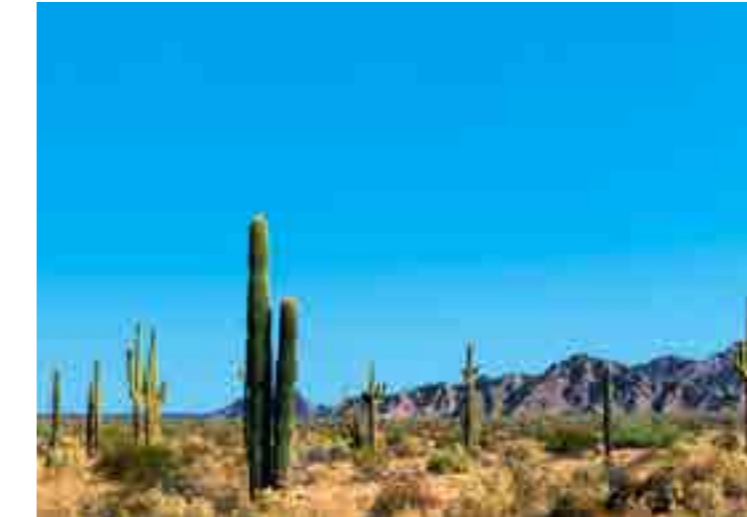
Sahuaros en El Desierto el Pinacate