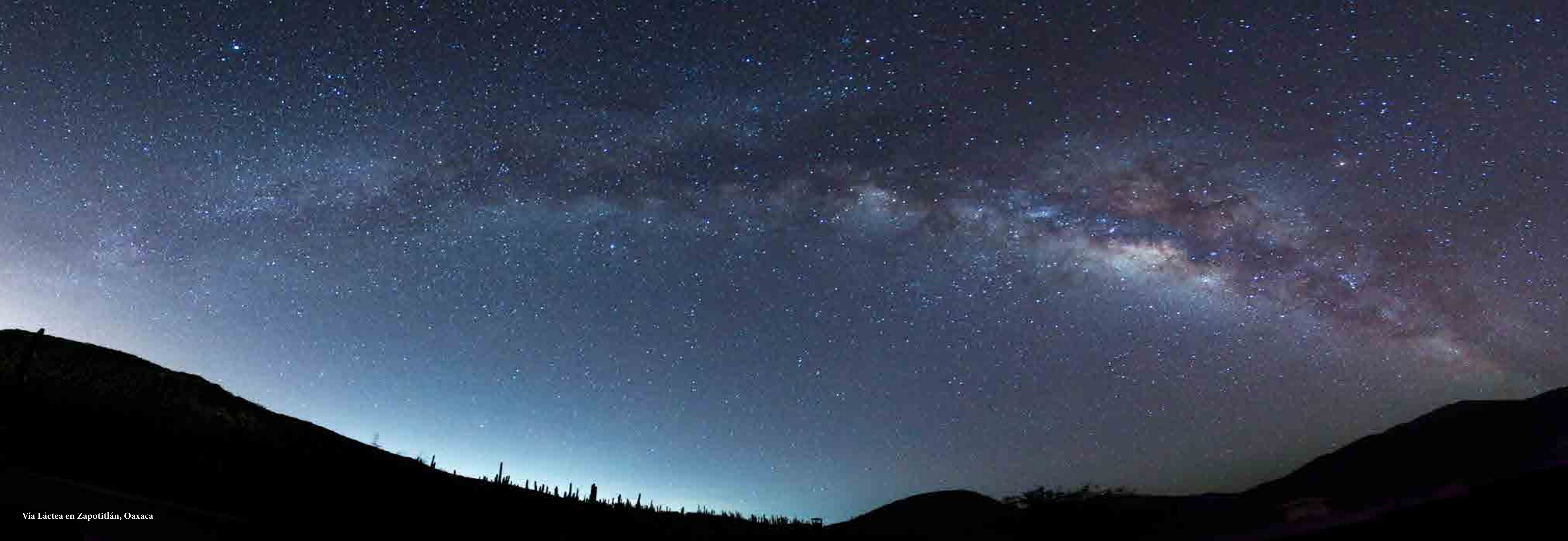
Vía Láctea en Zapotitlán, Oaxaca