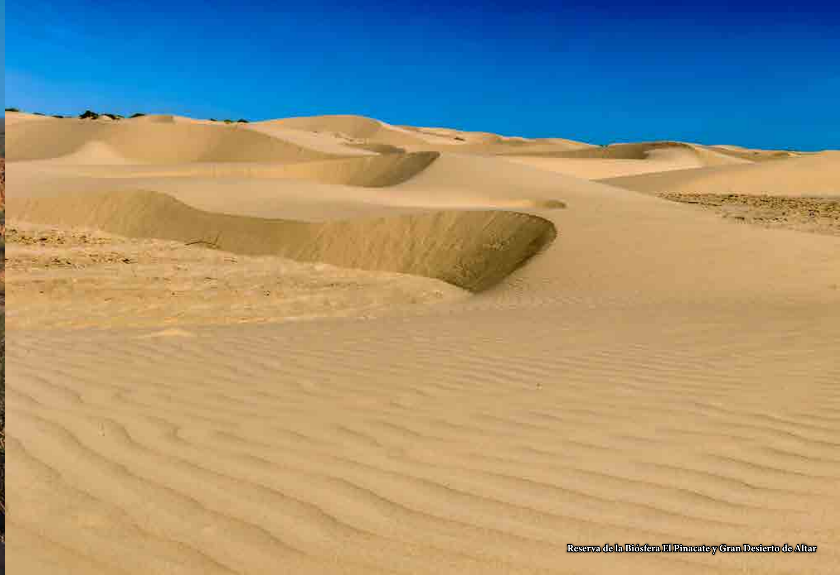
Reserva de la Biósfera El Pinacate y Gran Desierto de Altar