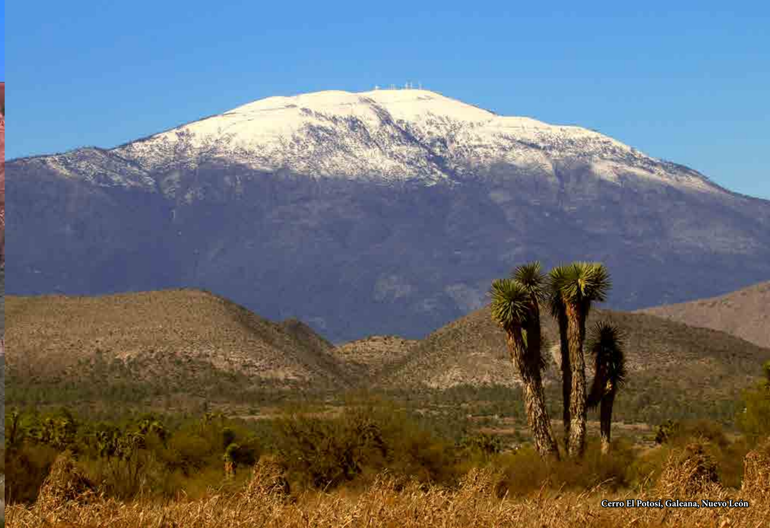
Cerro El Potosí, Galeana, Nuevo León