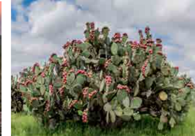
Nopalera, San Luis Potosí

El Desierto Chihuahuense es el más grande en Norteamérica y el segundo con mayor diversidad a nivel mundial. Es un territorio compartido por México y Estados Unidos que se extiende a lo largo de 630,000 km 2 y está delimitado por los dos sistemas montañosos más grandes de México: la Sierra Madre Oriental y Occidental. Incluye los estados mexicanos de Chihuahua, Coahuila, Nuevo León, Tamaulipas, Durango, Zacatecas, San Luis Potosí y una pequeña porción de Querétaro, Guanajuato e Hidalgo, y en Estados Unidos, Arizona, Nuevo México y Texas.