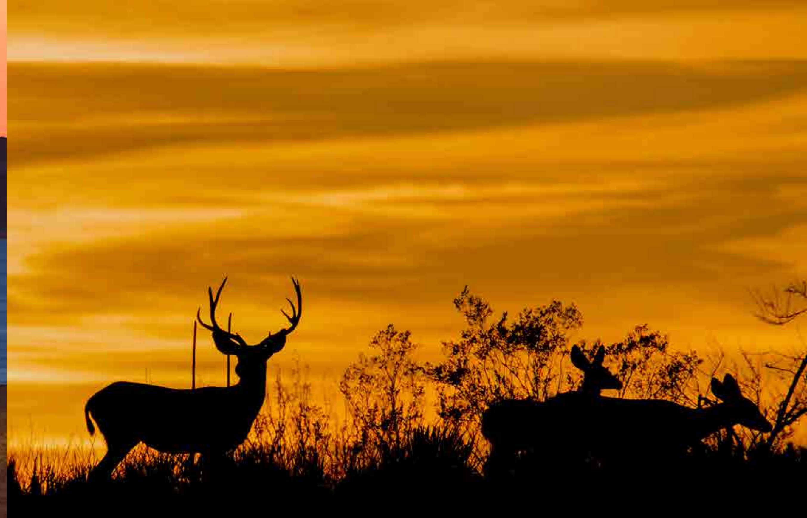
Venados Bura, Caborca, Sonora