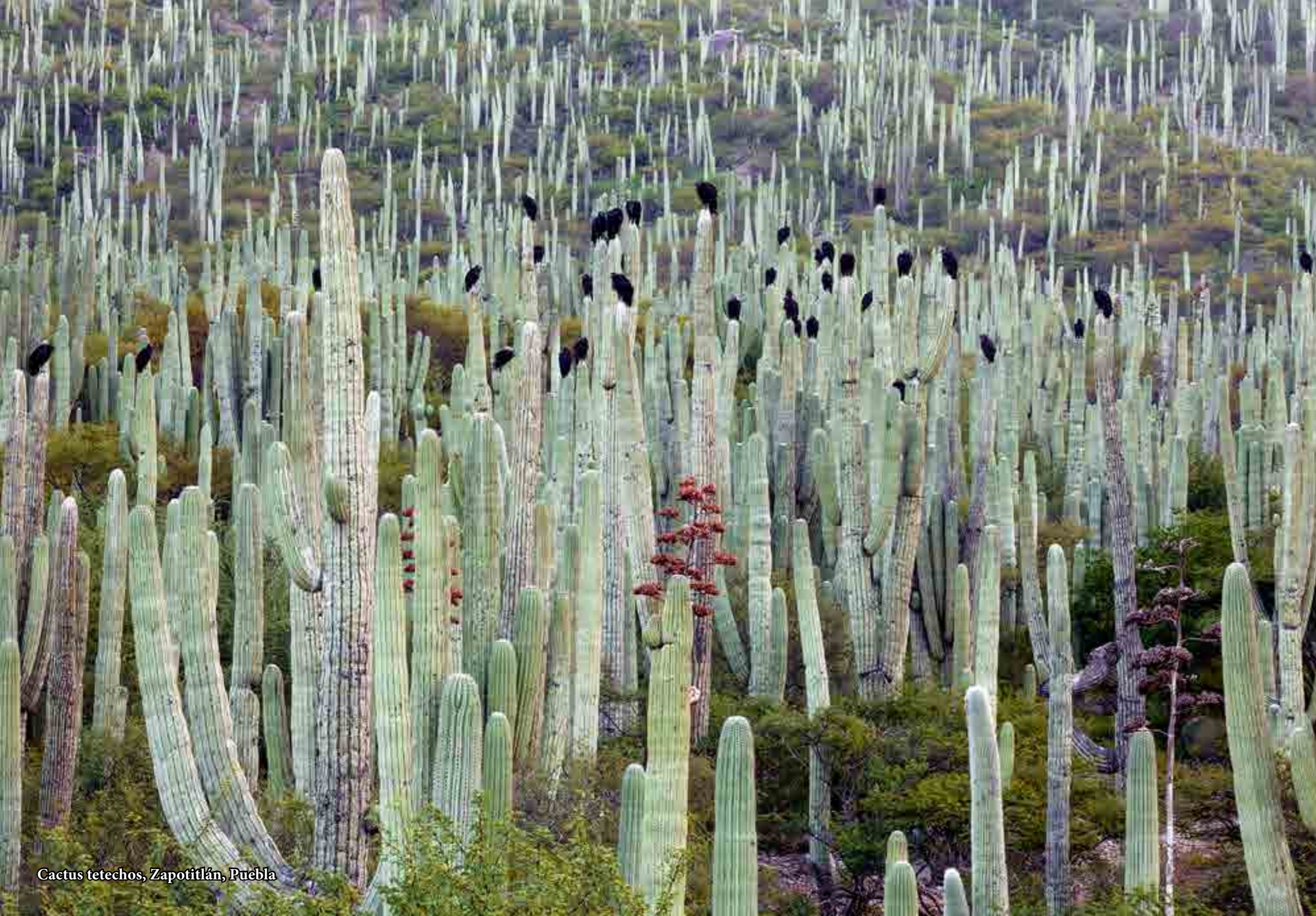
Cactus tetchos, Zapotitlán, Puebla