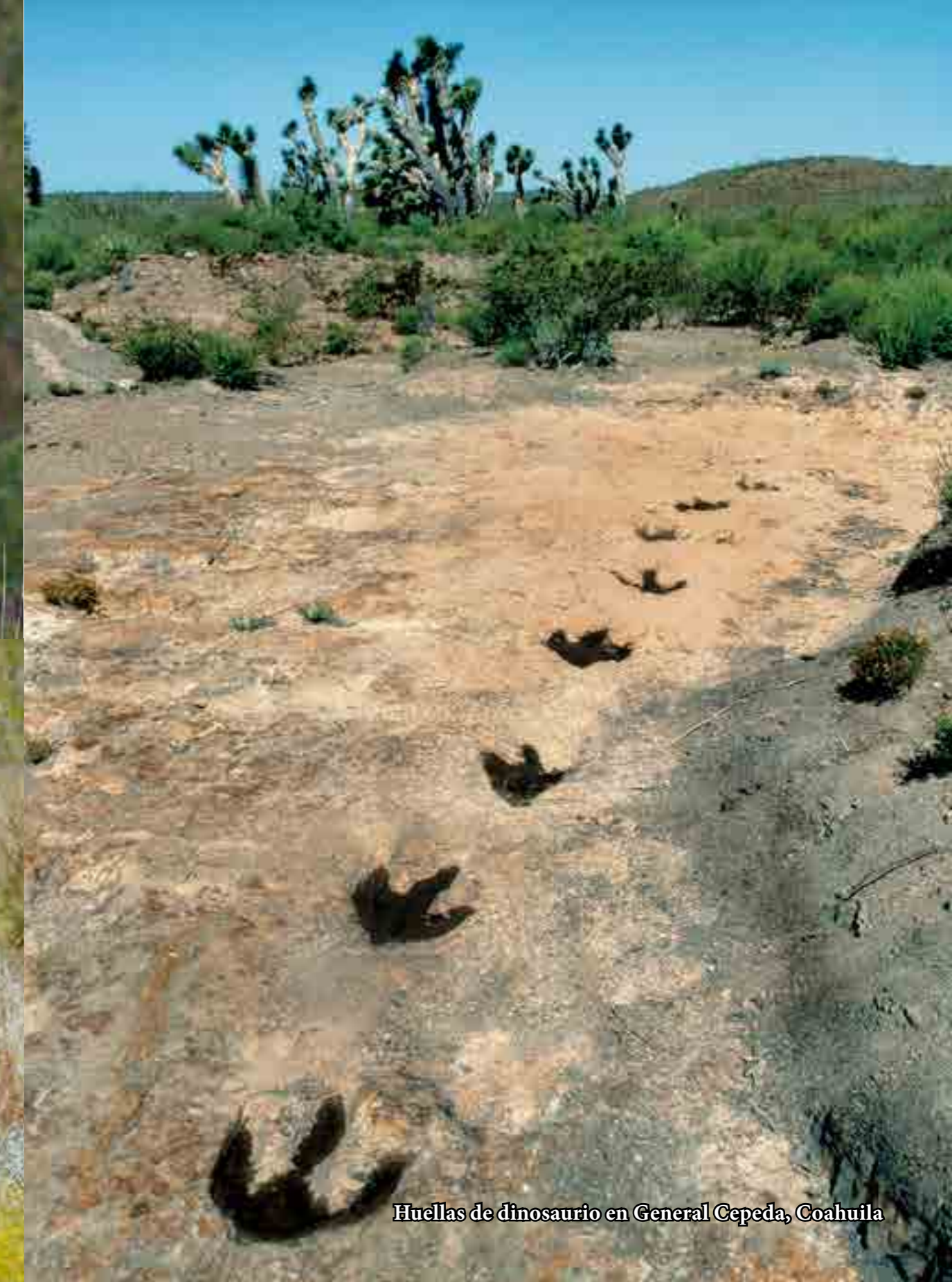
Huellas de dinosaurio en General Cepeda, Coahuila