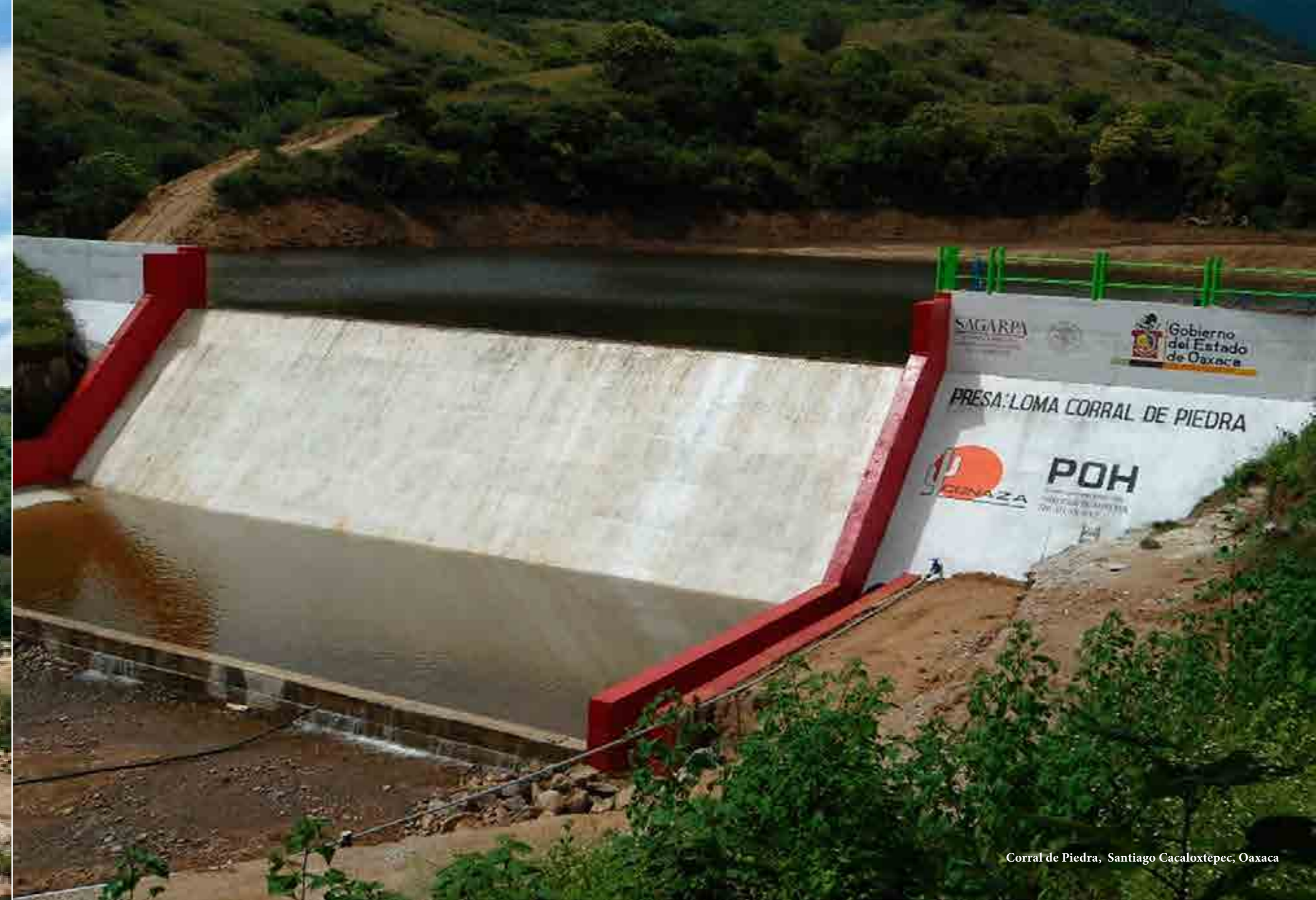
Corral de Piedra, Santiago Cacaloxtotec, Oaxaca