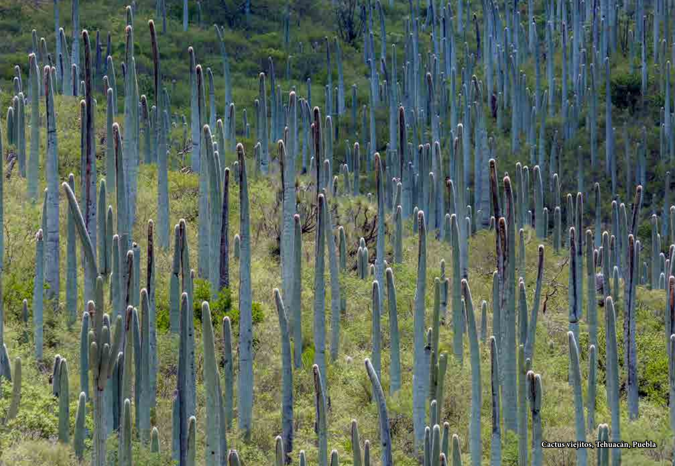
Cactus viejitos, Tehuacán, Puebla