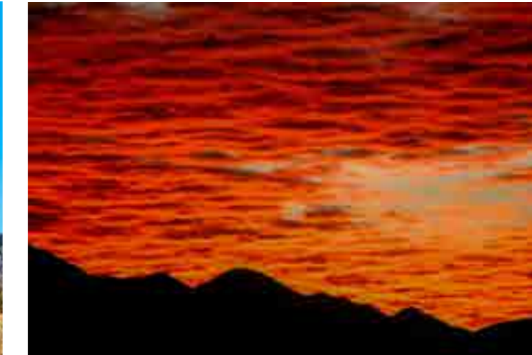
Atardecer en Álamos, Sonora

El Desierto Sonorense está localizado en América del Norte, abarcando grandes extensiones de Arizona y California en Estados Unidos, así como del estado mexicano de Sonora, del cual recibe su nombre. Es uno de los desiertos más calurosos y grandes del mundo, pues cubre un área de 311 000 km 2 .