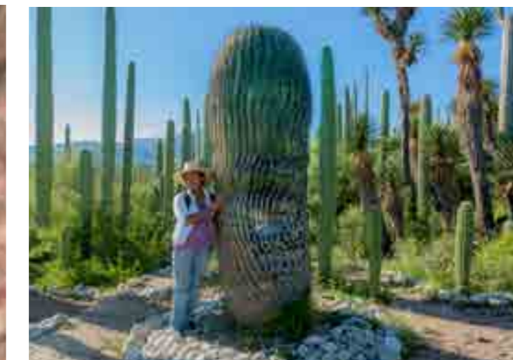
Biznaga gigante en San Juan Raya, Puebla

Esta zona se encuentra entre la Sierra Madre del Sur y el Eje Volcánico Transversal y se caracteriza por su relieve accidentado, cuenta con una superficie de 4,901.9 km 2 Aquí se encuentra la Reserva de la Biosfera Tehuacán – Cuicatlán que abarca parte de los estados de Puebla y Oaxaca. Tiene una gran diversidad florística, principalmente de cactáceas columnares en grandes concentraciones. Aquí se encuentra el Santuario de la guacamaya verde y abundan los mamíferos como el venado, la zorro gris y el gato montés, inclusive se han documentado el jaguar y el puma. El clima en general es semiárido, seco y caluroso en verano y temperatura media de 25°C.