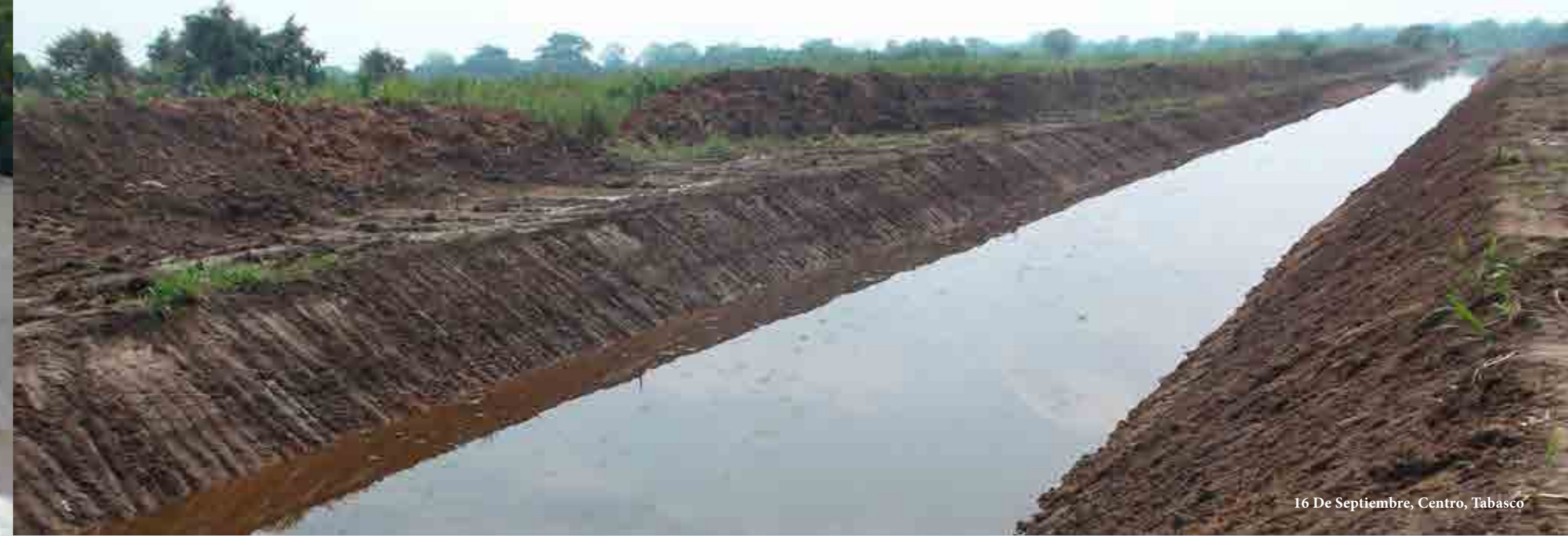
16 De Septiembre, Centro, Tabasco