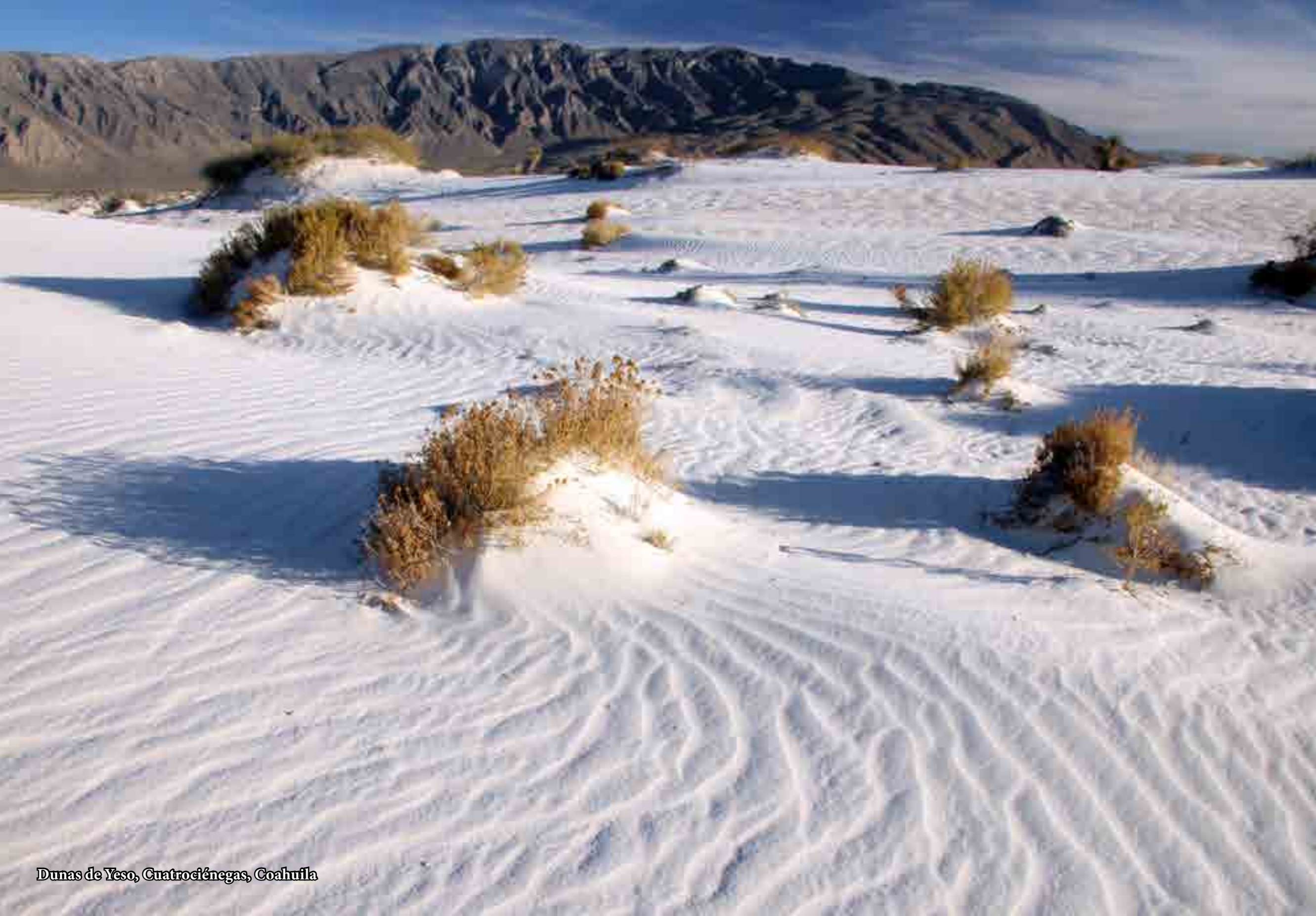
Dunas de Yeso, Cuatrociénegas, Coahuila