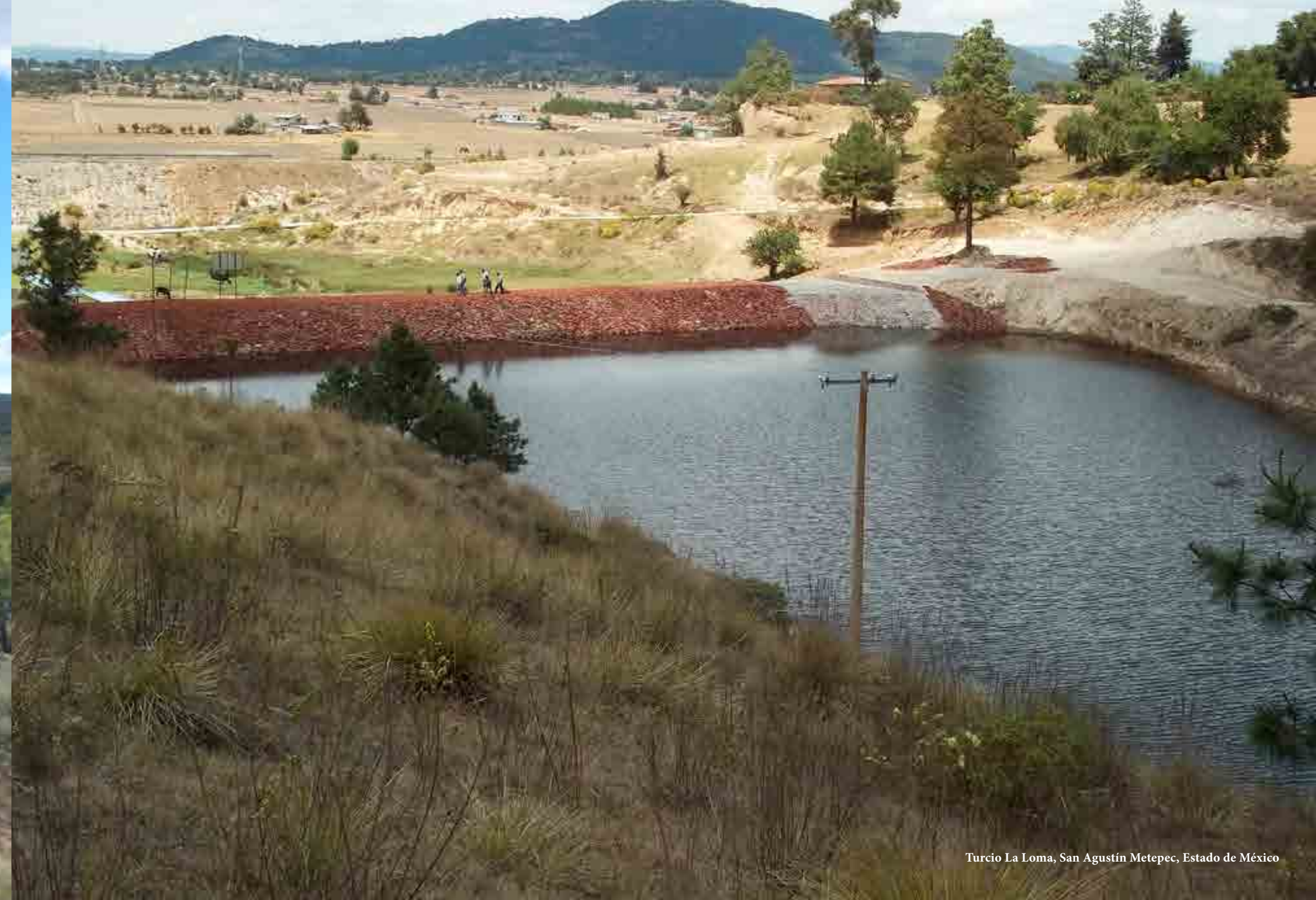
Turcio La Loma, San Agustín Metepec, Estado de México