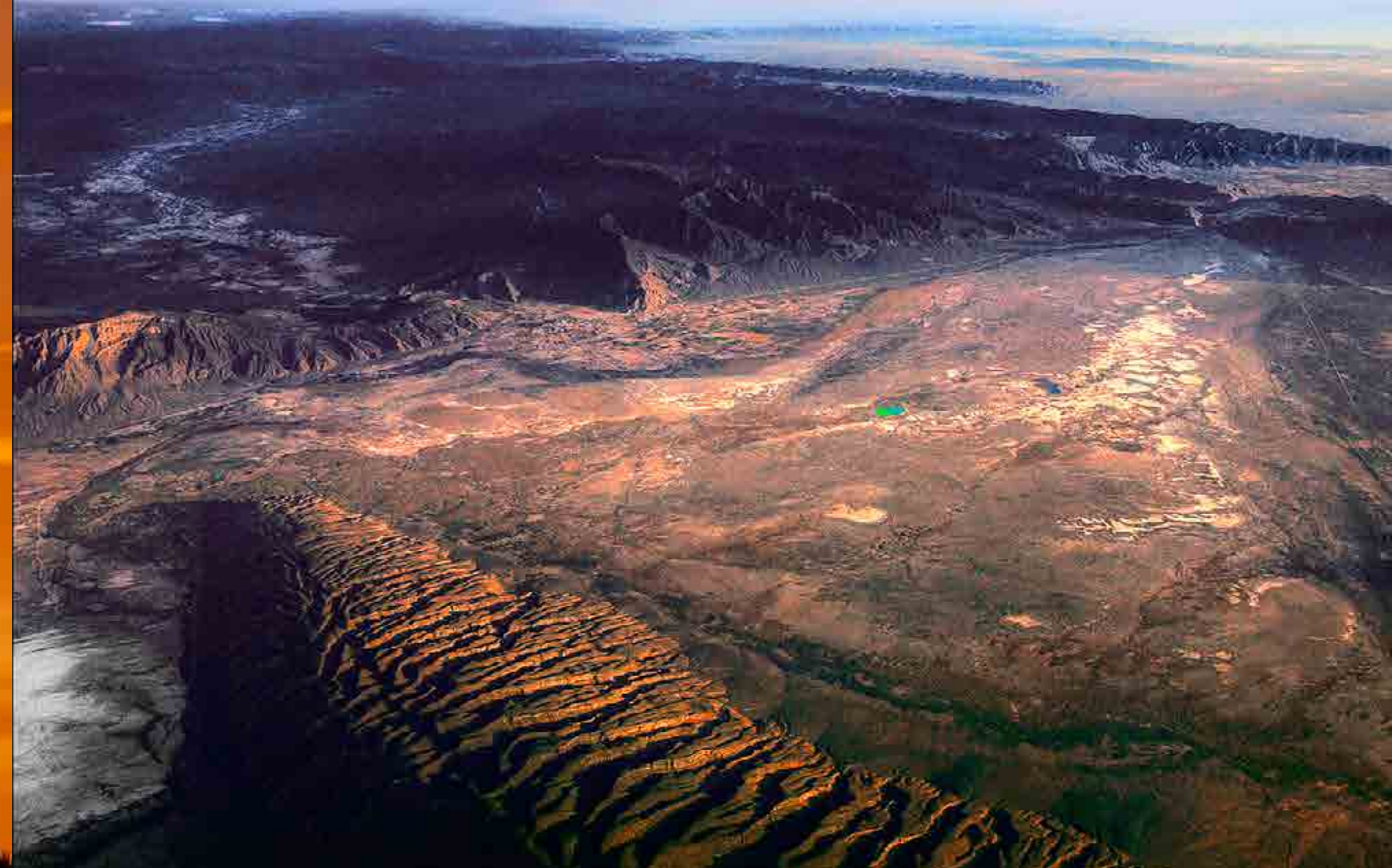
Sierra San Marcos y Pinos y Valle de Cuatrociénegas, Coahuila