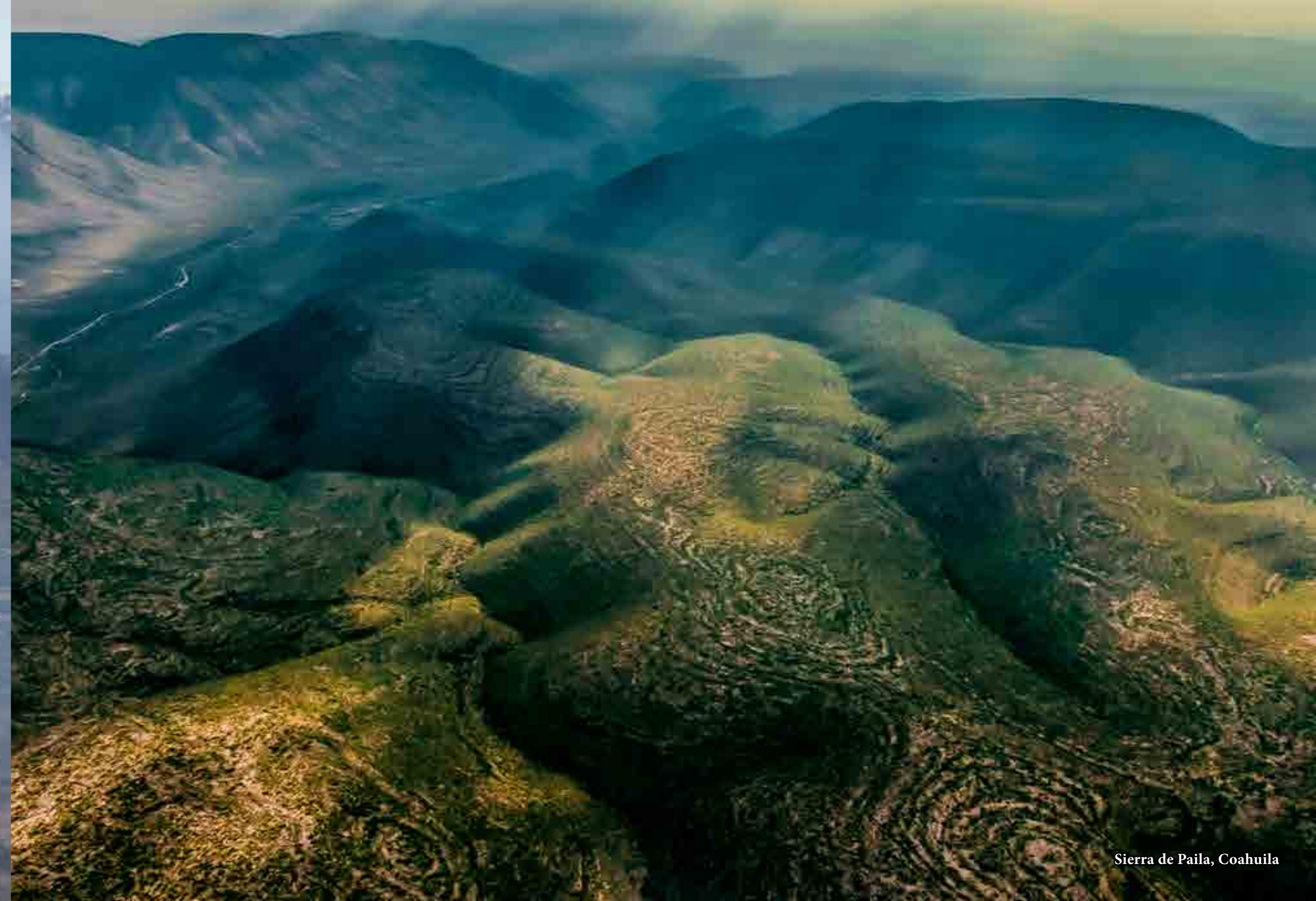
Sierra de Paila, Coahuila