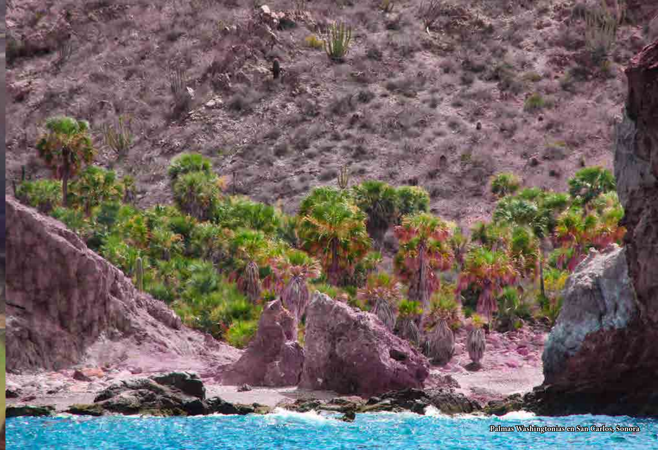
Palmas Washingtonias en San Carlos, Sonora