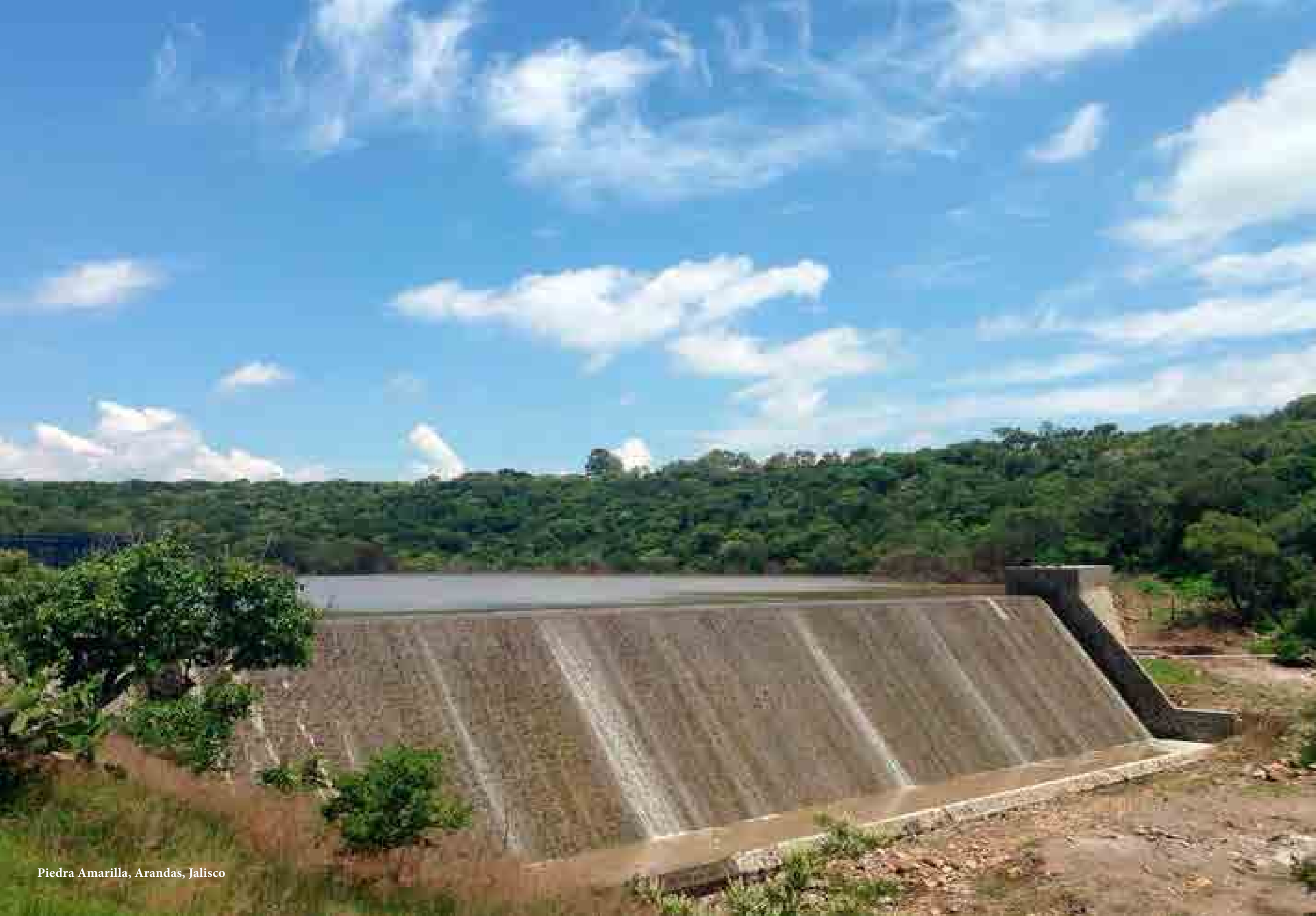
Piedra Amarilla, Arandas, Jalisco