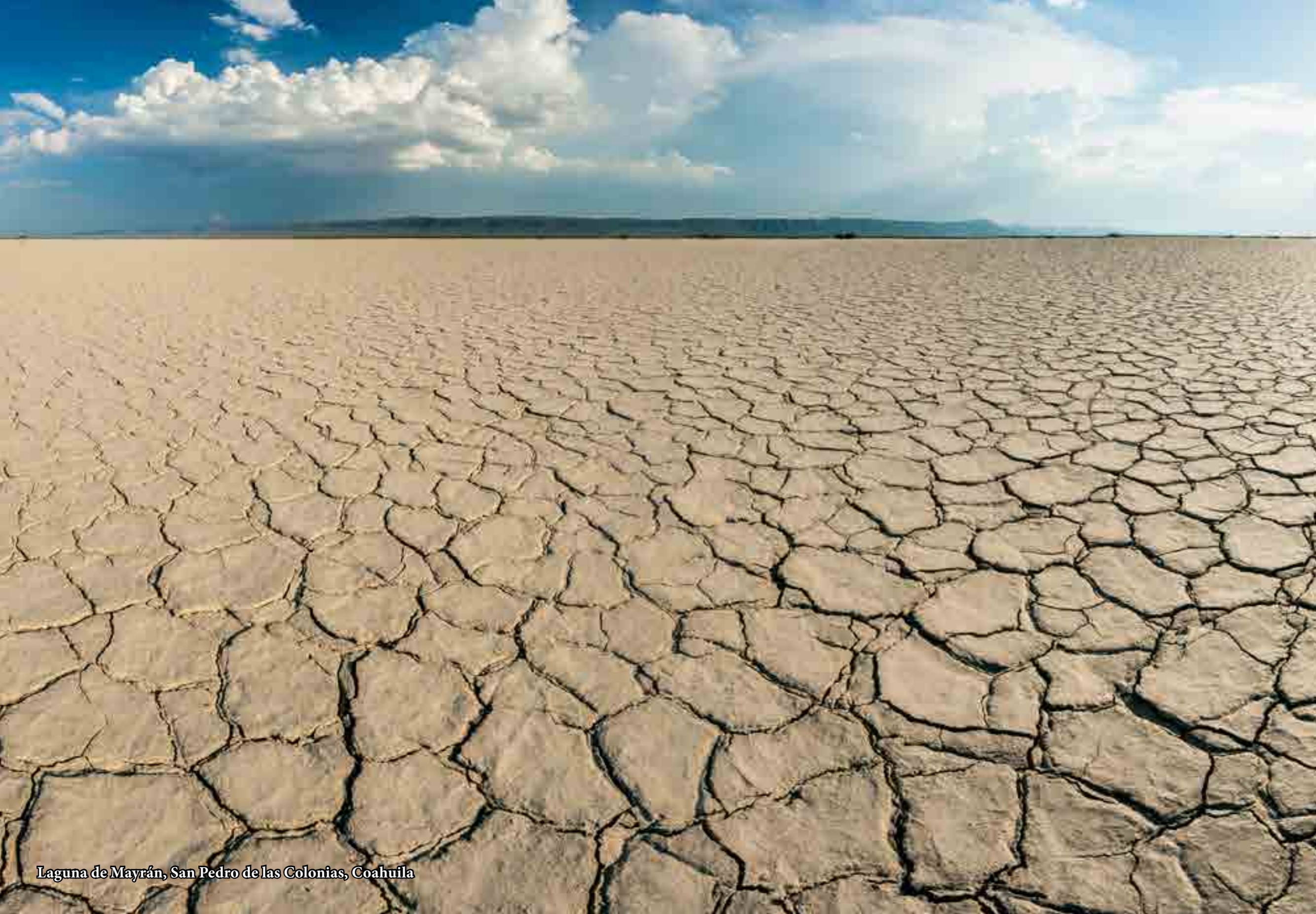
Laguna de Mayrán, San Pedro de las Colonias, Coahuila