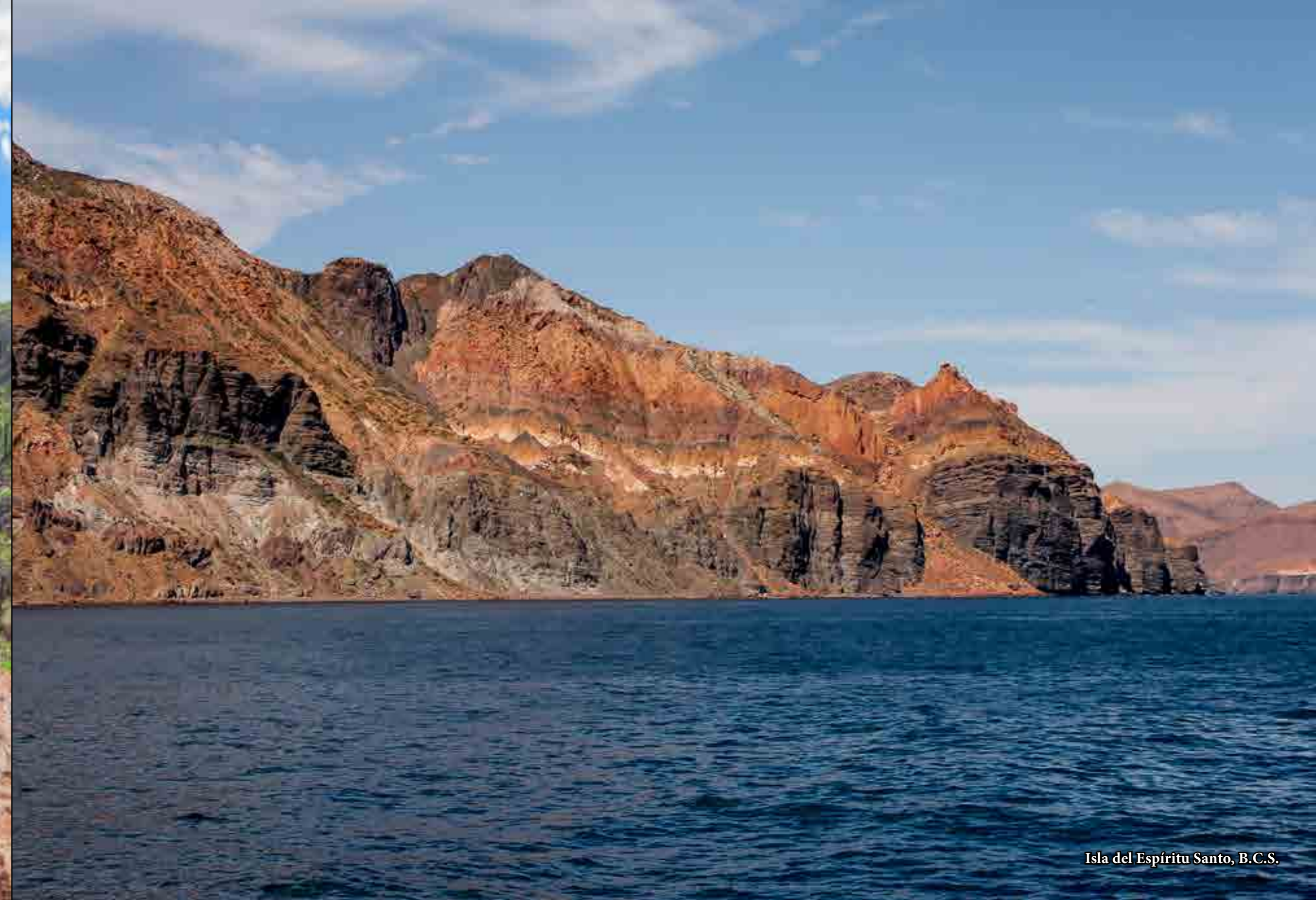
Isla del Espíritu Santo, B.C.S.