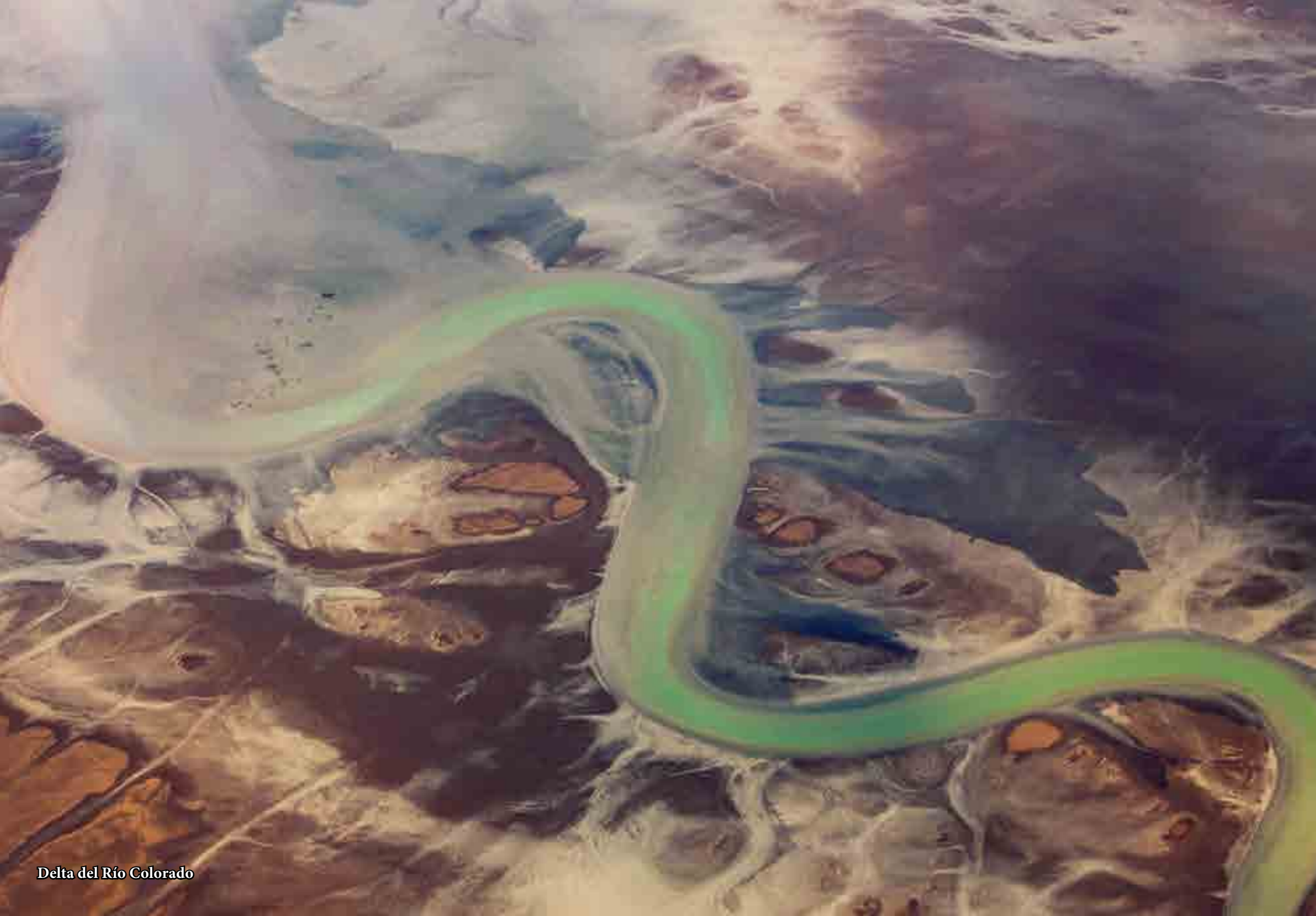
Delta del Río Colorado