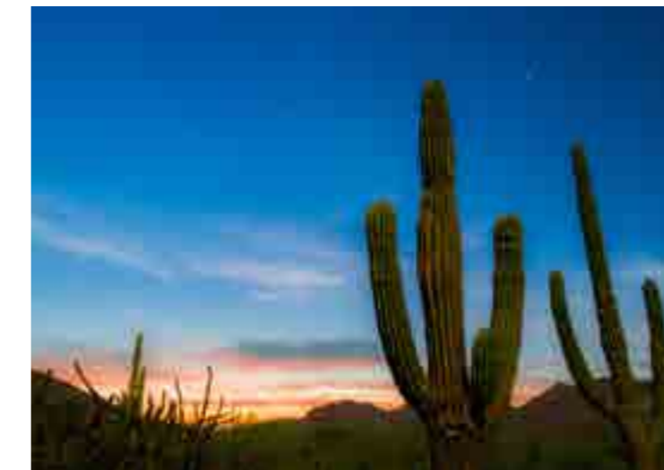
Cardones, Bahía de Balandra, B.C.S.