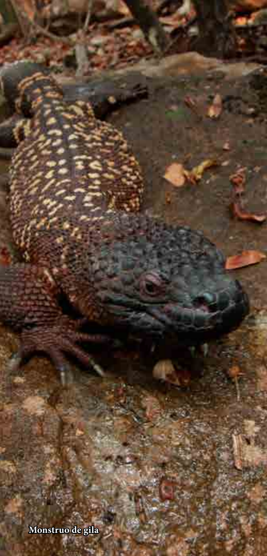
Monstruo de gila