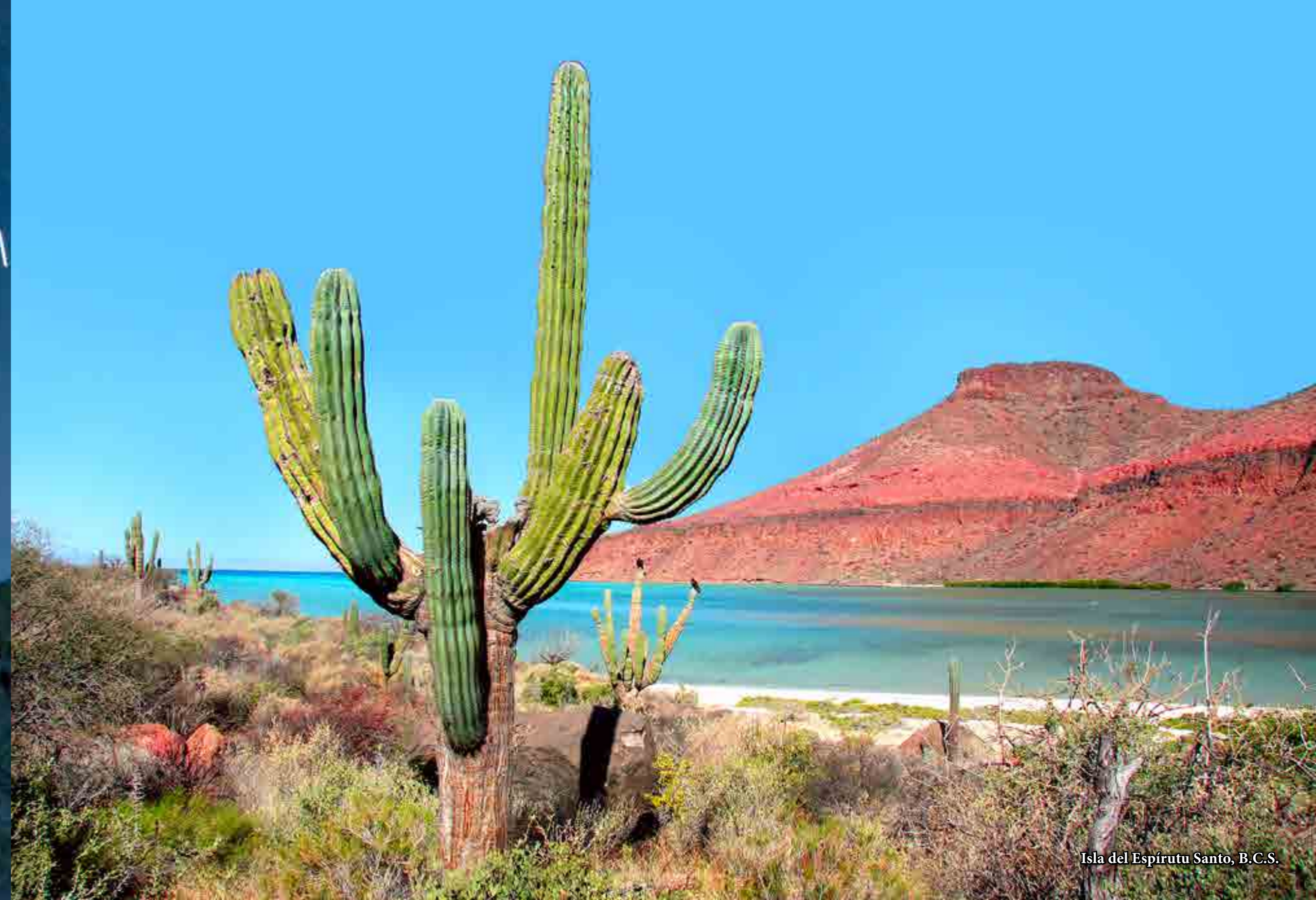
Isla del Espíritu Santo, B.C.S.