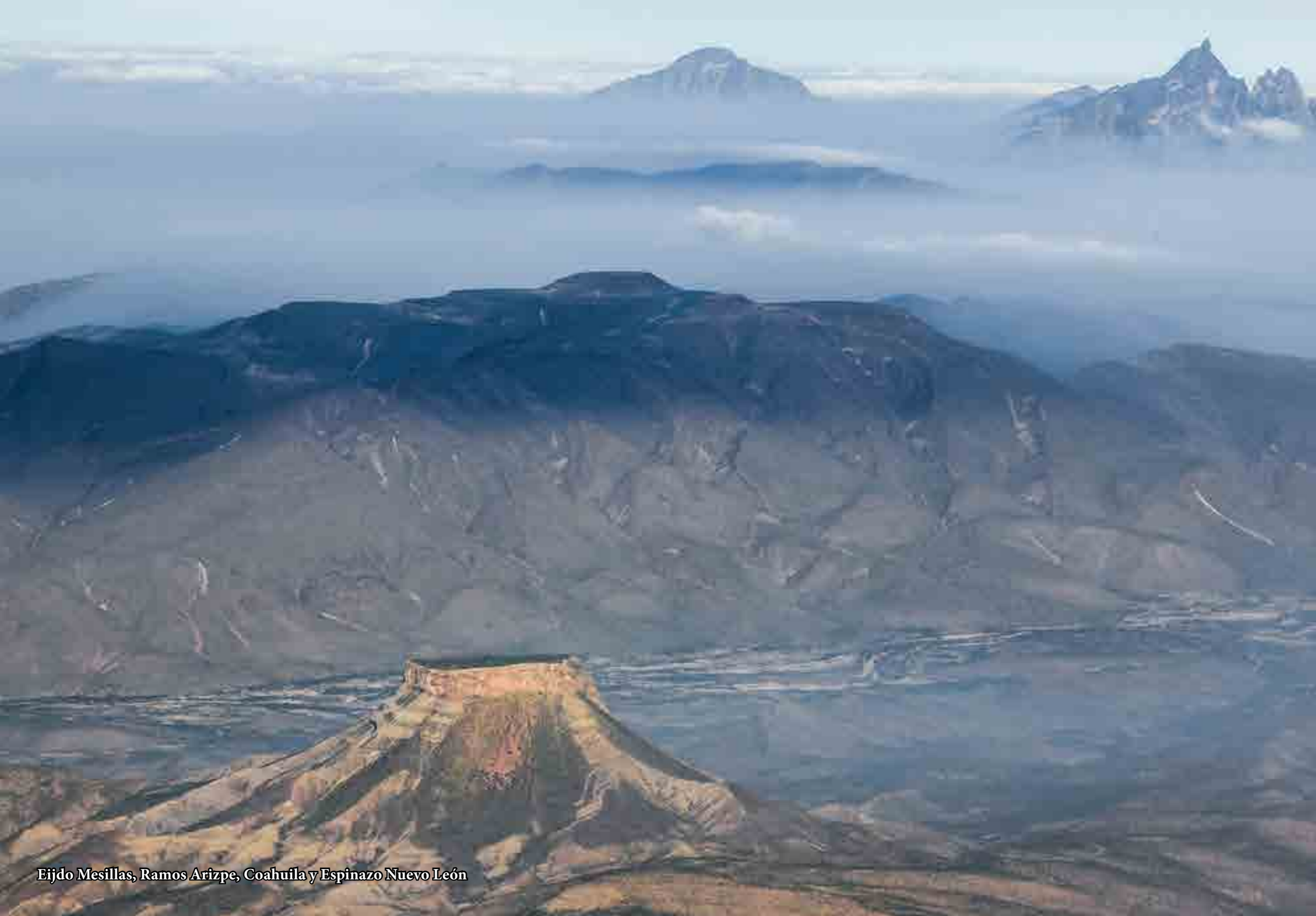
Ejido Mesillas, Ramos Arizpe, Coahuila y Espinazo Nuevo León