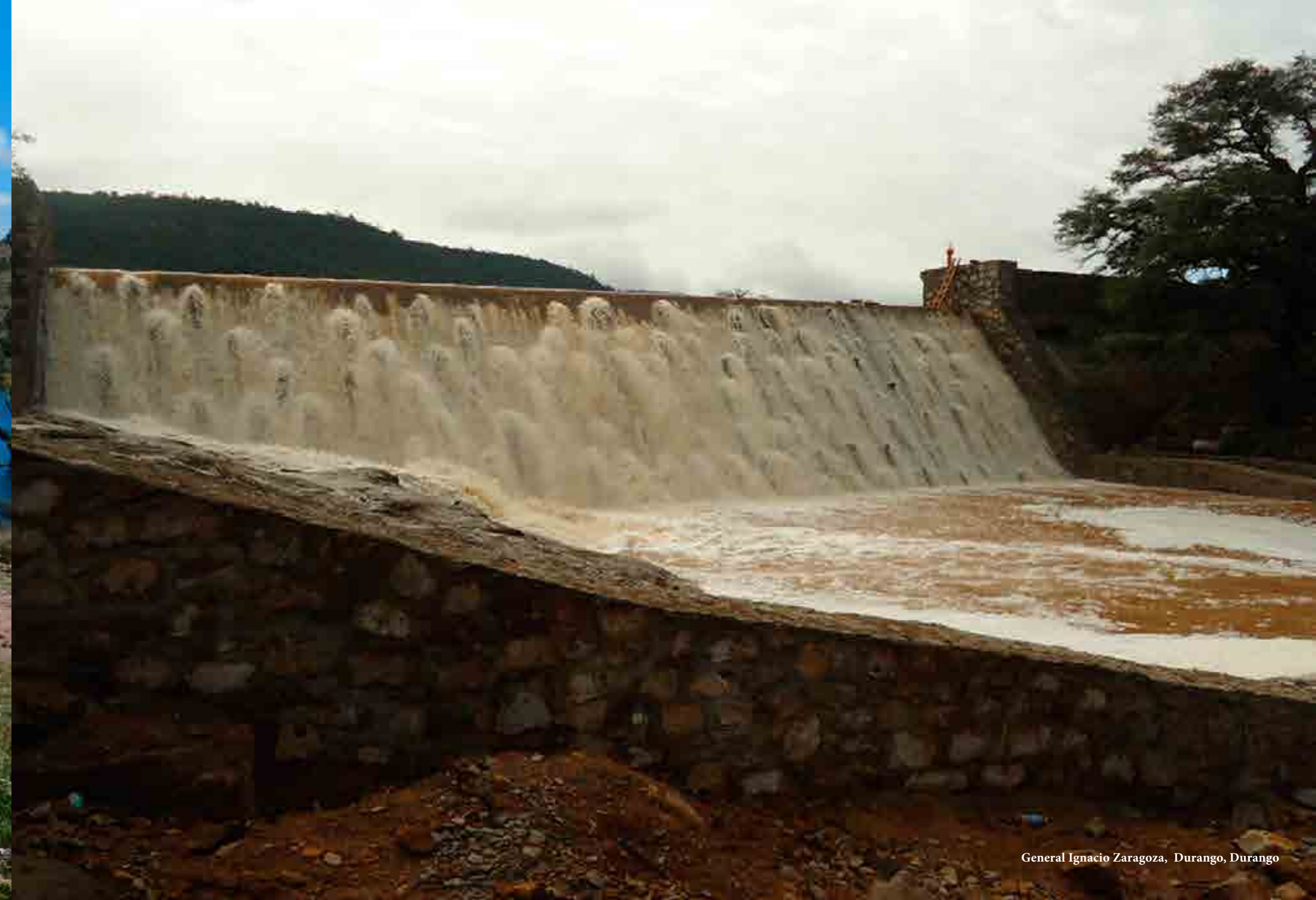
General Ignacio Zaragoza, Durango, Durango