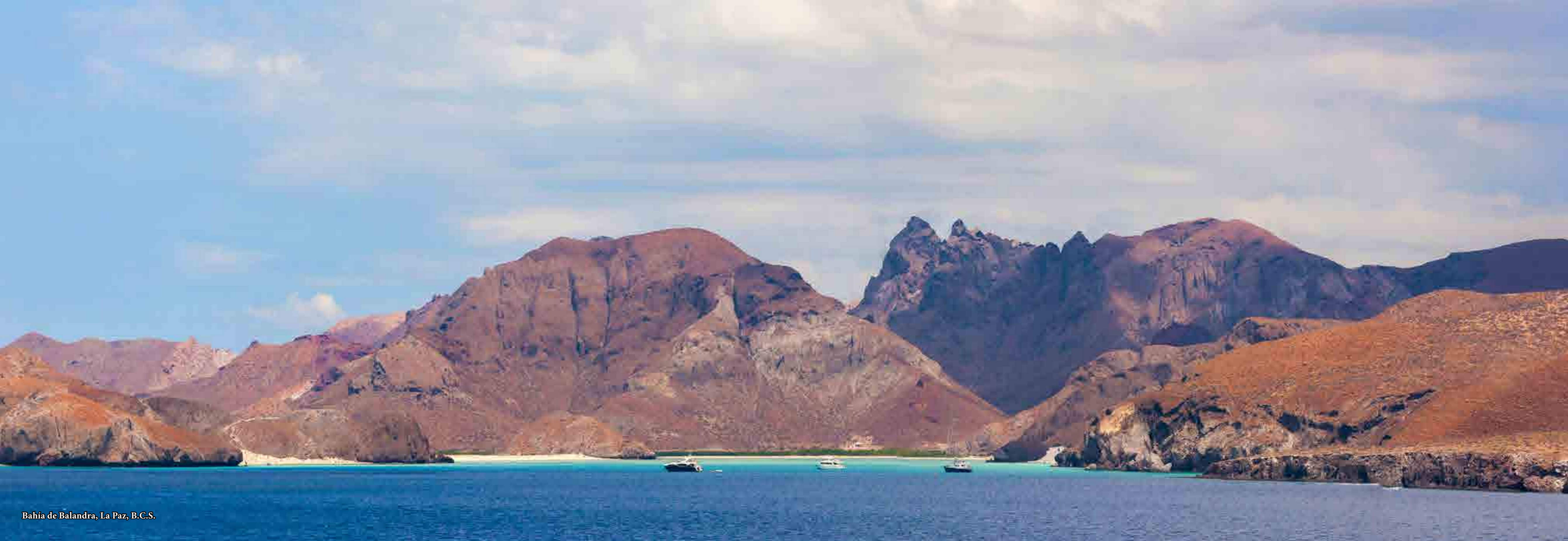
Bahía de Balandra, La Paz, B.C.S.