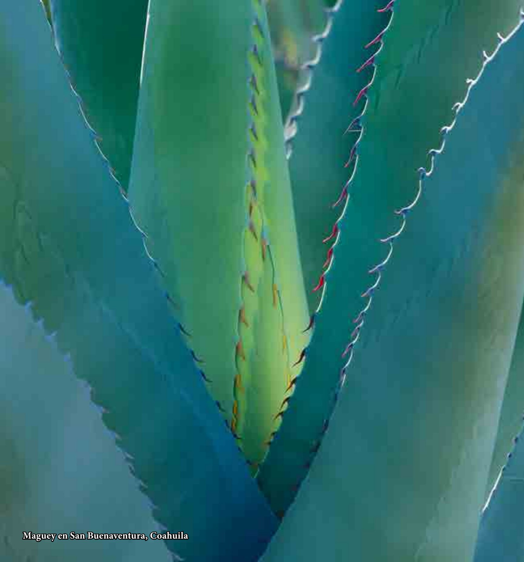
Maguey en San Buenaventura, Coahuila