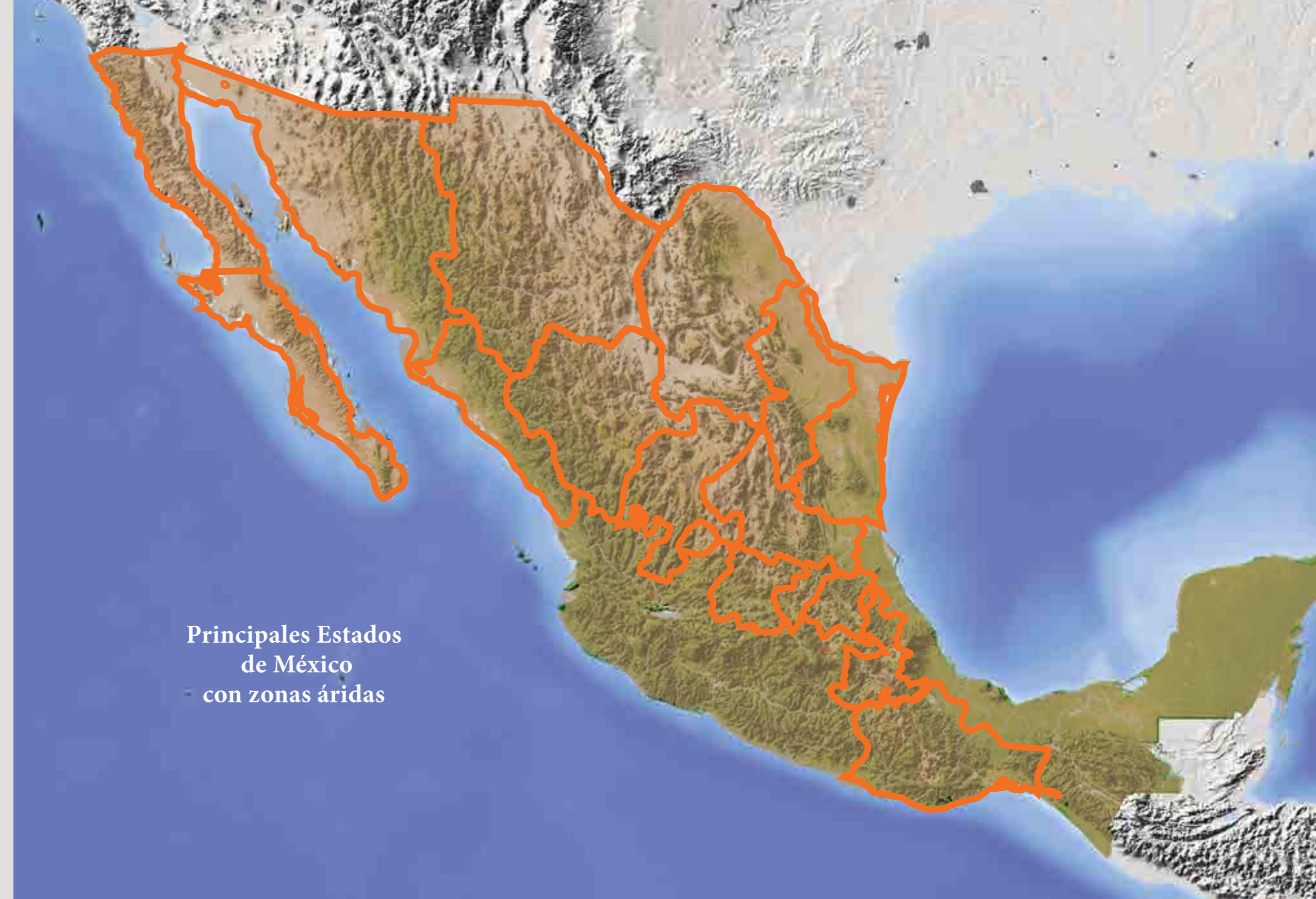
Principales Estados de México con zonas áridas