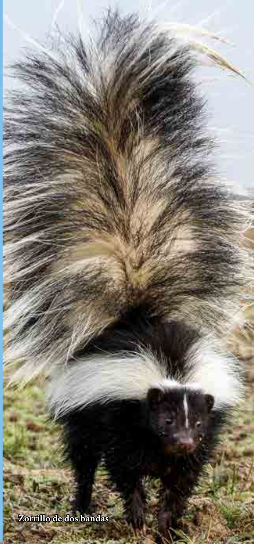
Zorrillo de dos bandas