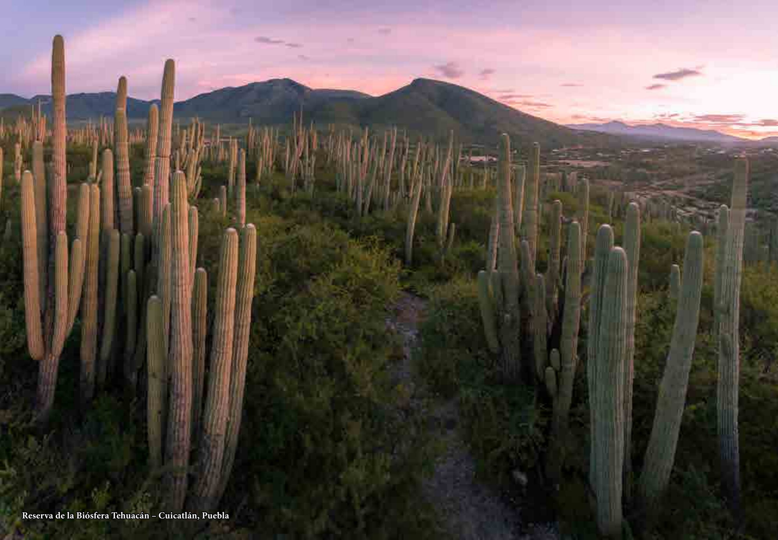
Reserva de la Biósfera Tehuacán - Cuicatlán, Puebla