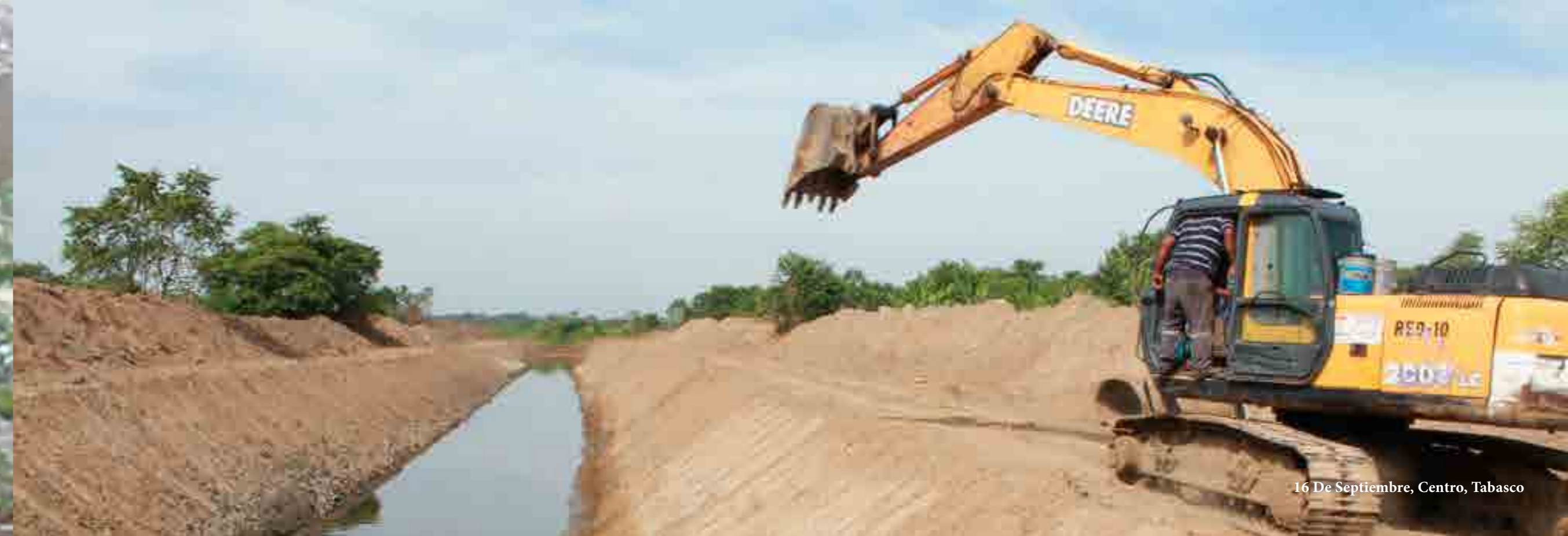
16 De Septiembre, Centro, Tabasco