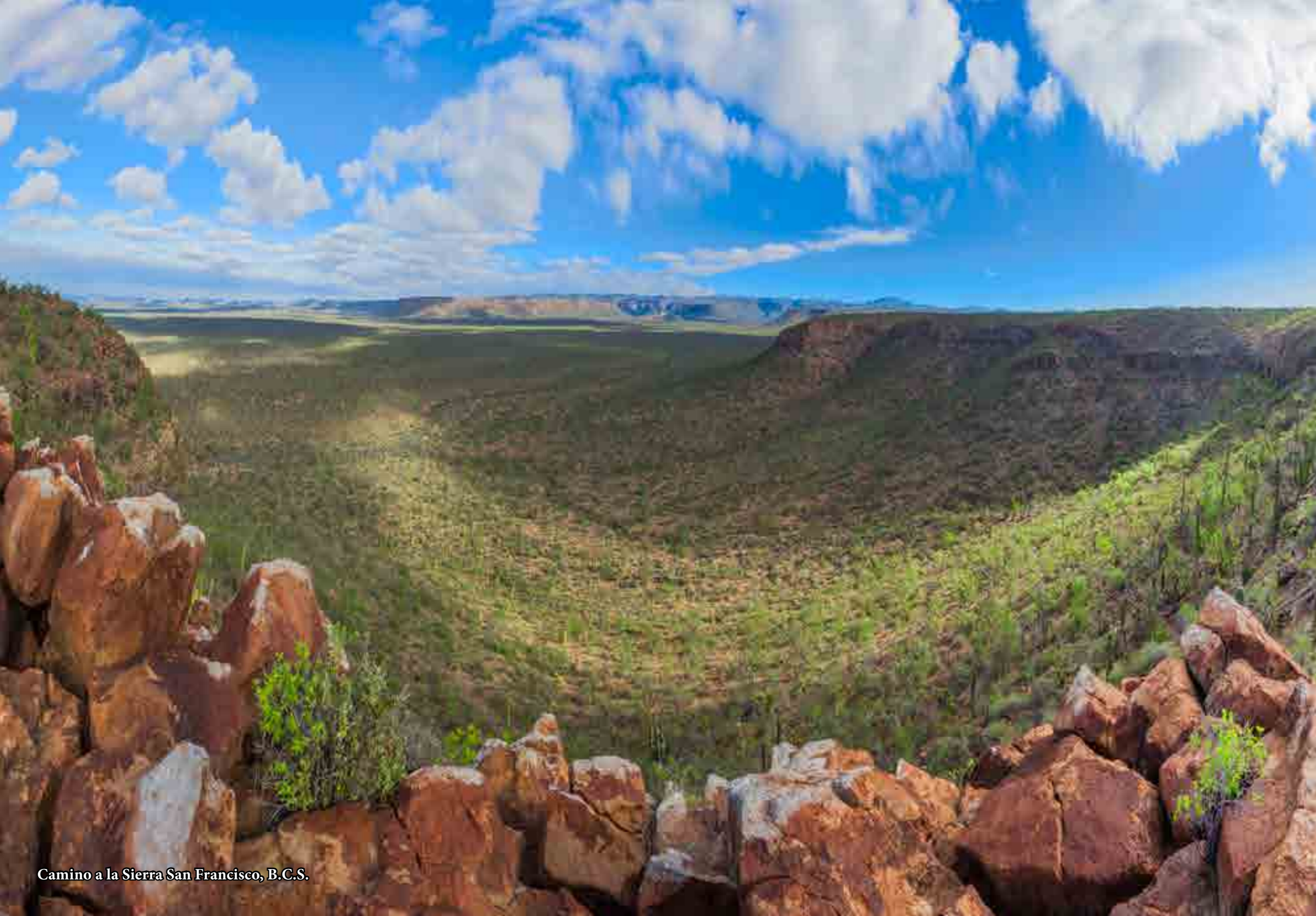
Camino a la Sierra San Francisco, B.C.S.