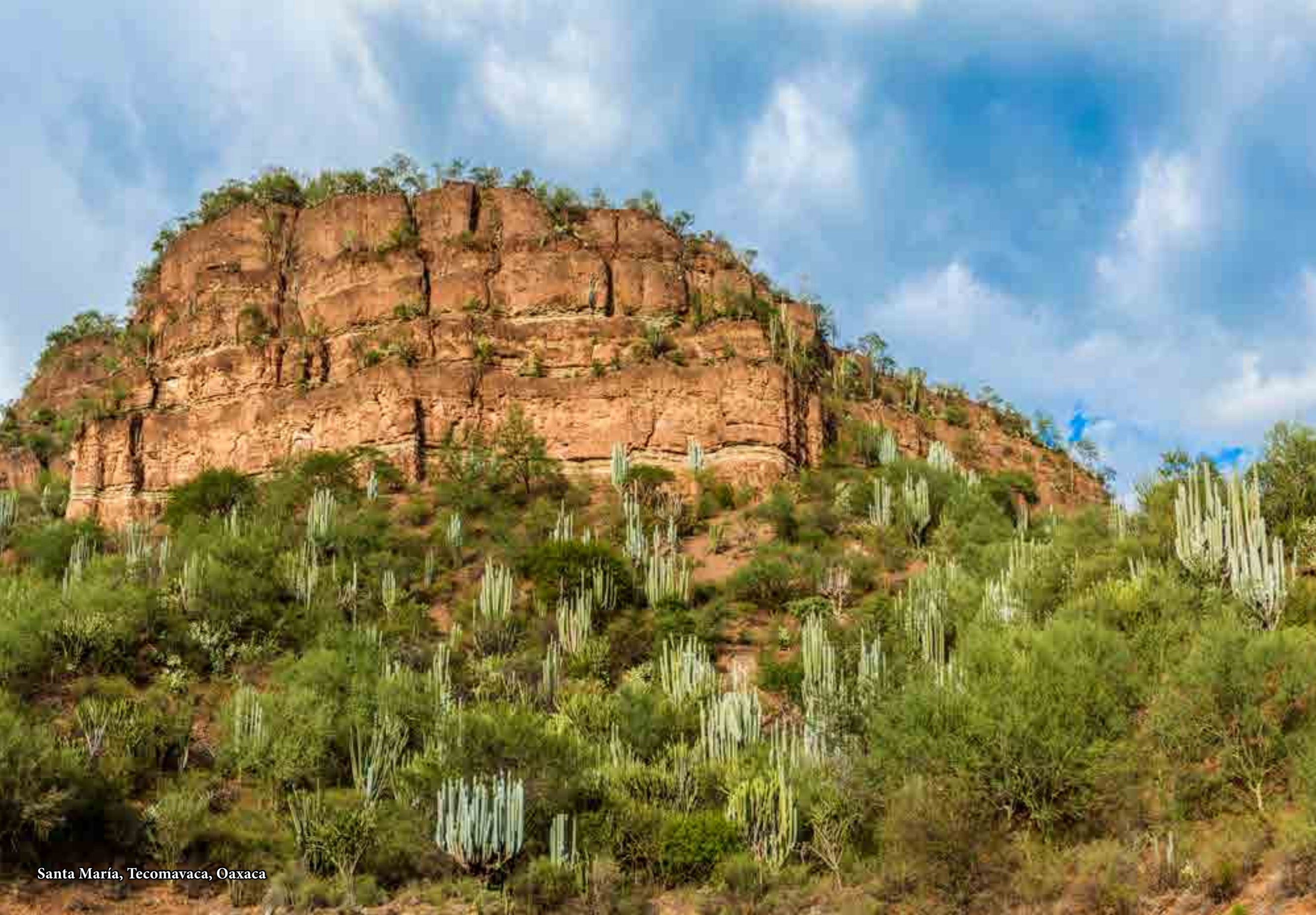
Santa María, Tecomavaca, Oaxaca