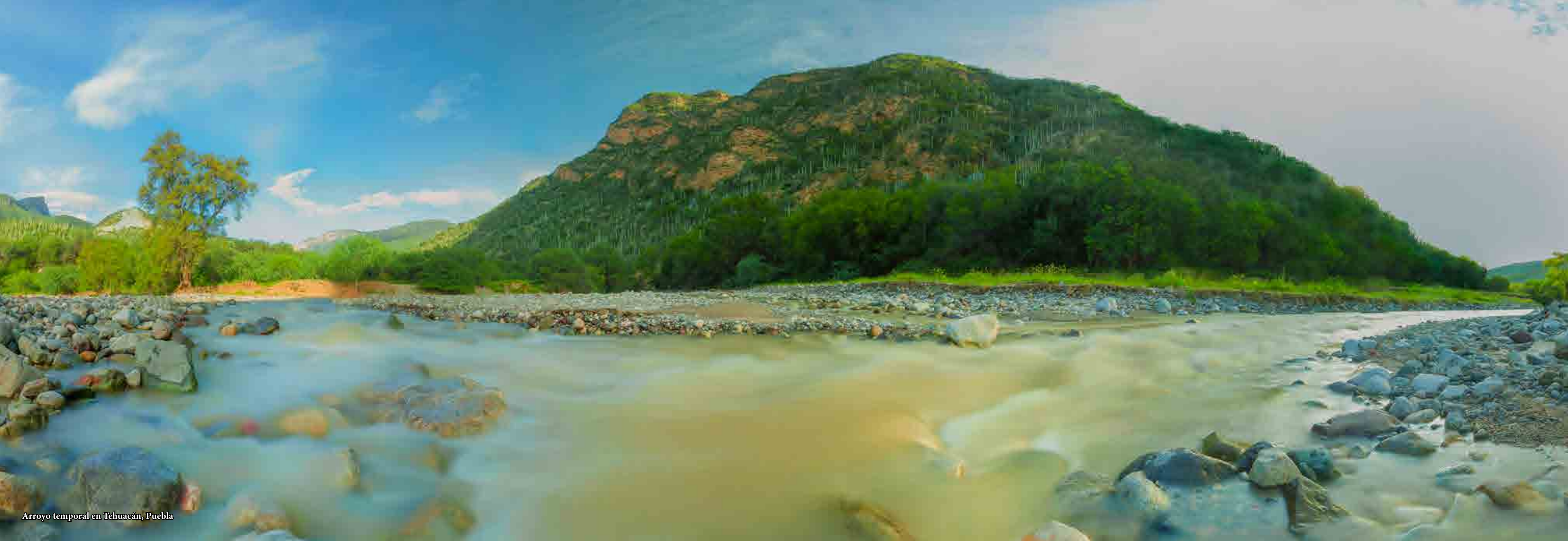
Arroyo temporal en Tehuacán, Puebla