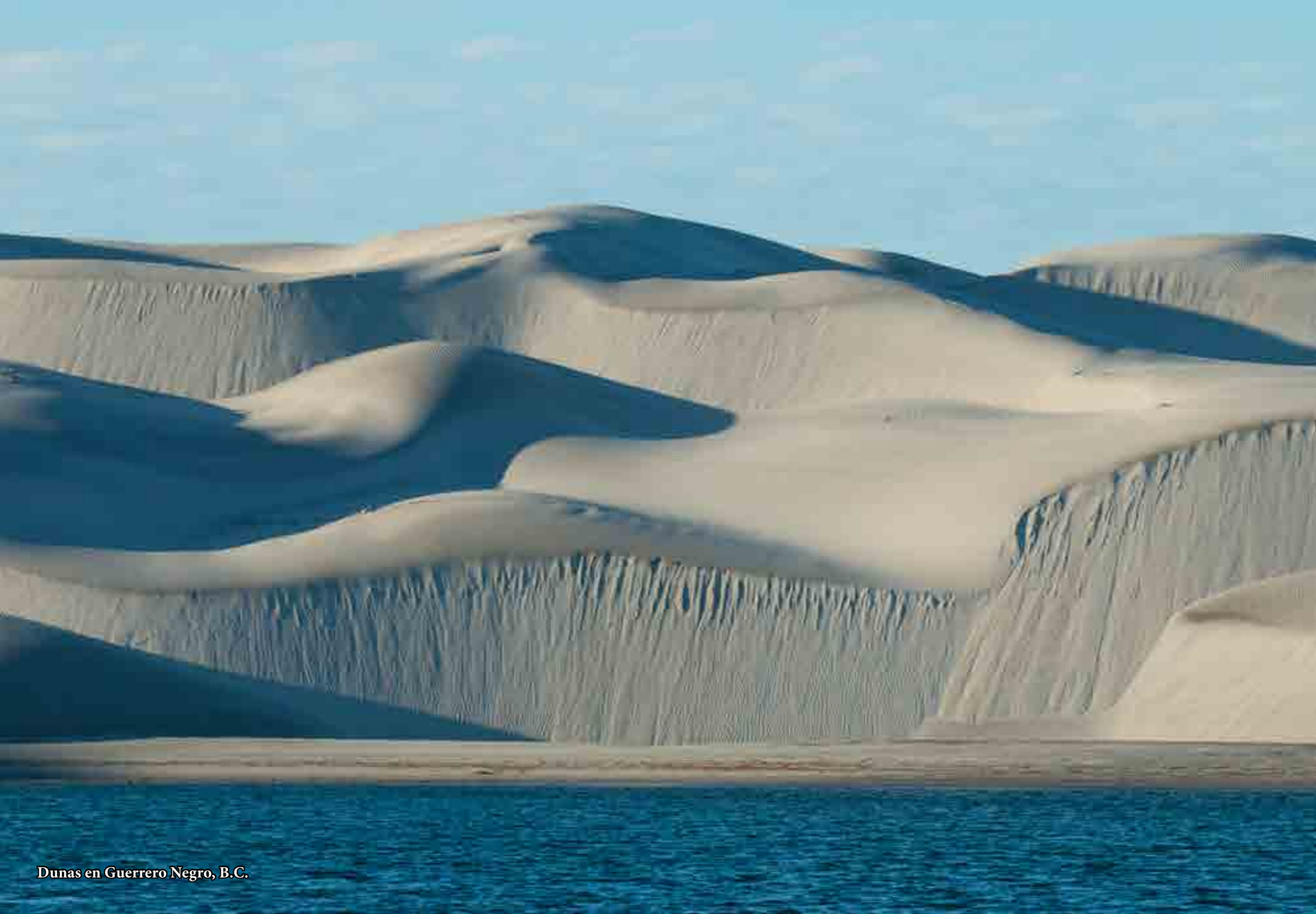
Dunas en Guerrero Negro, B.C.