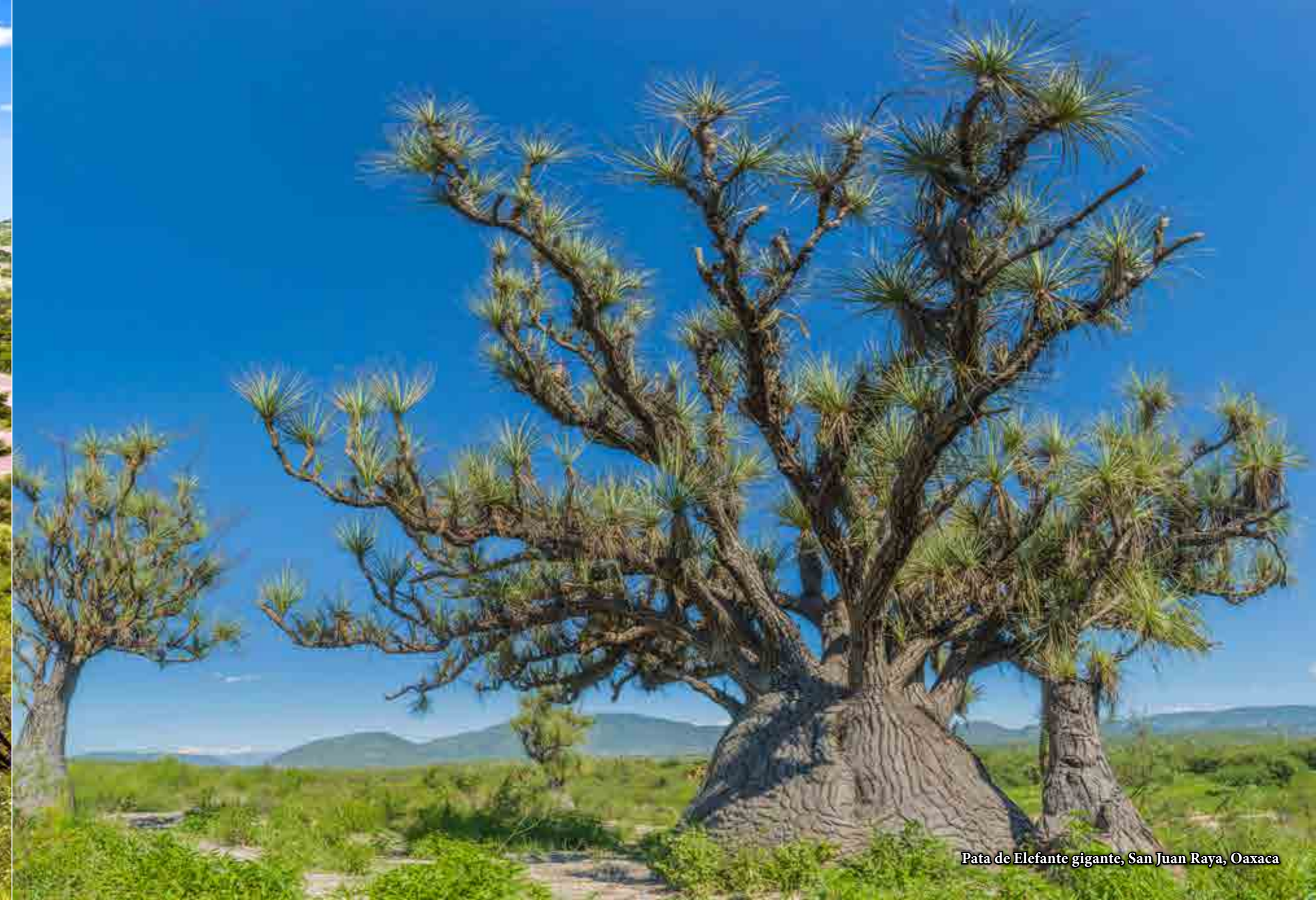
Pata de Elefante gigante, San Juan Raya, Oaxaca