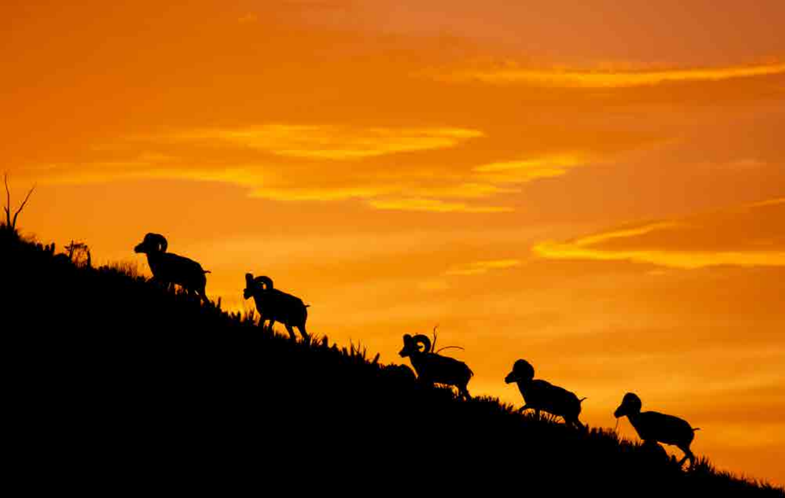
Borregos cimarrones, Sierra de San Marcos y Pinos, Cuatrociénegas, Coahuila