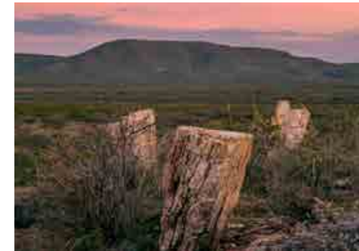
Troncos petrificados, Jiménez, Chihuahua