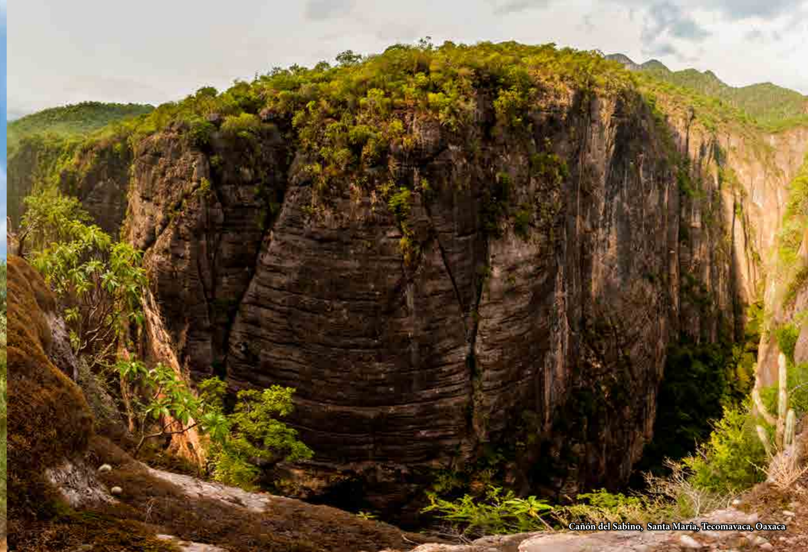
Cañón del Sabino, Santa María, Tecomavaca, Oaxaca