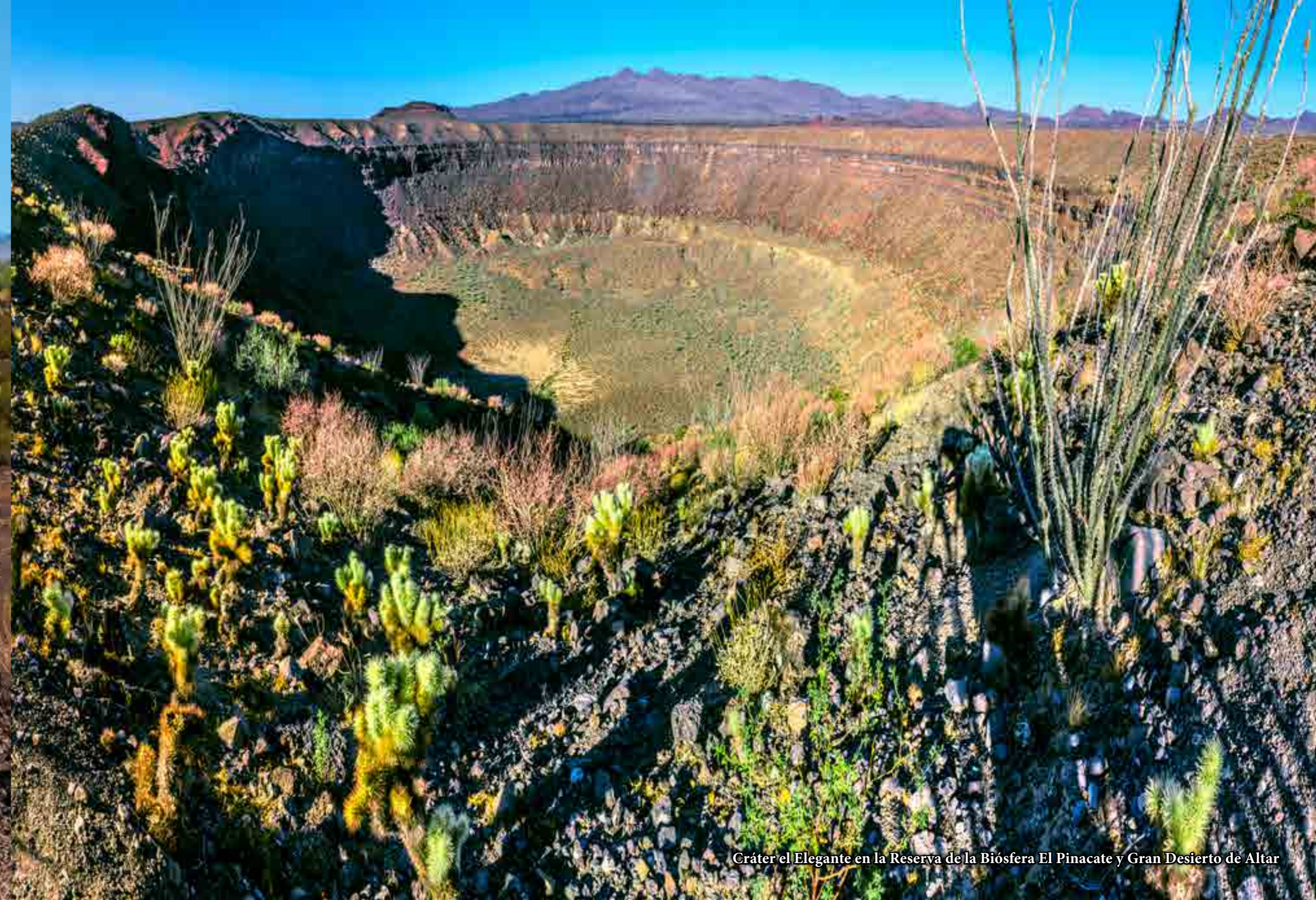
Cráter el Elegante en la Reserva de la Biósfera El Pinacate y Gran Desierto de Altar