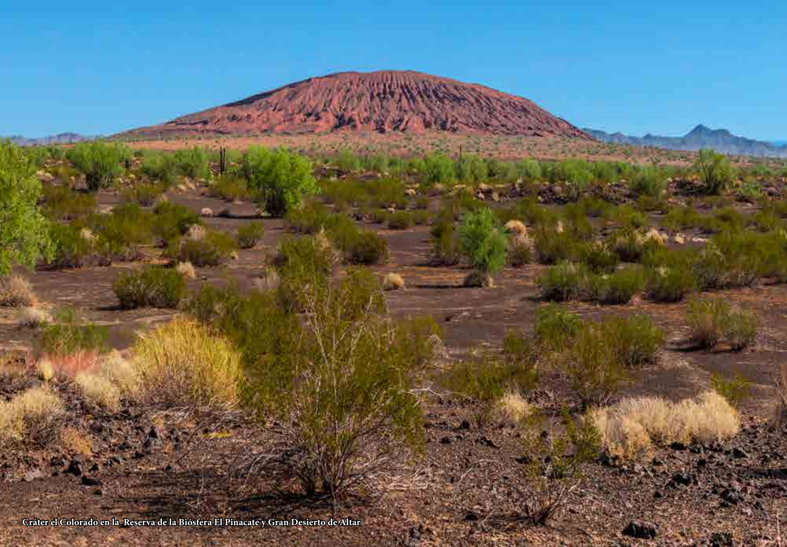
Cráter el Colorado en la Reserva de la Biósfera El Pinacate y Gran Desierto de Altar