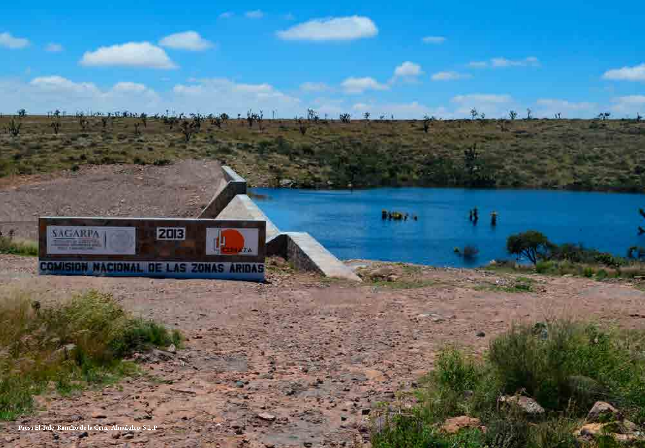
Presa El Tule, Rancho de la Cruz, Ahualulco, S.L.P.