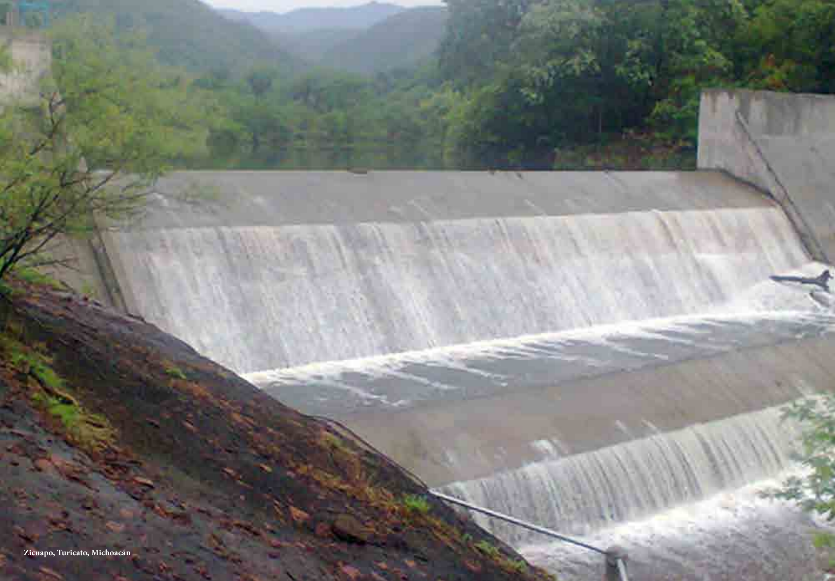
Zicuapo, Turicato, Michoacán