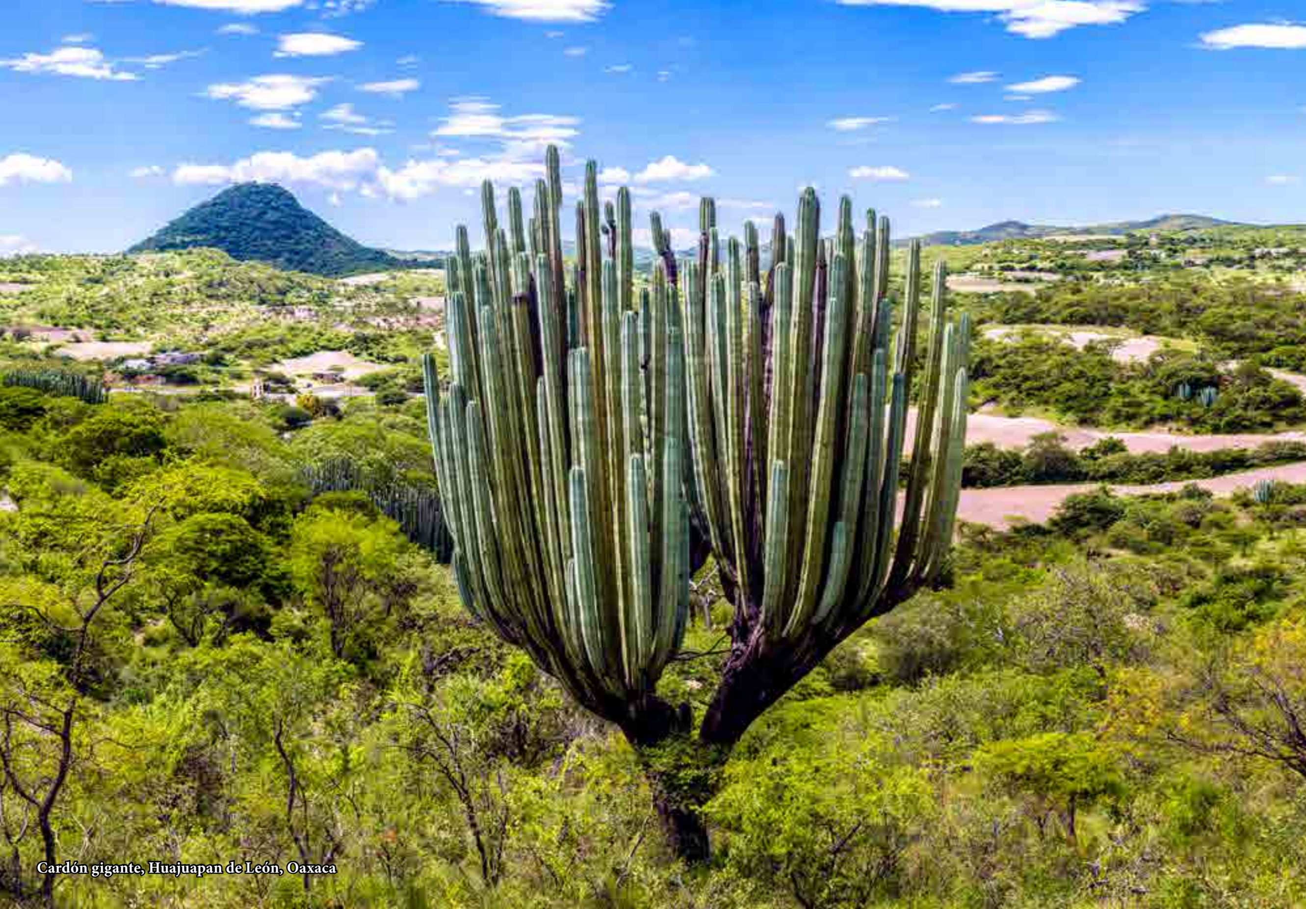
Cardón gigante, Huajuapán de León, Oaxaca