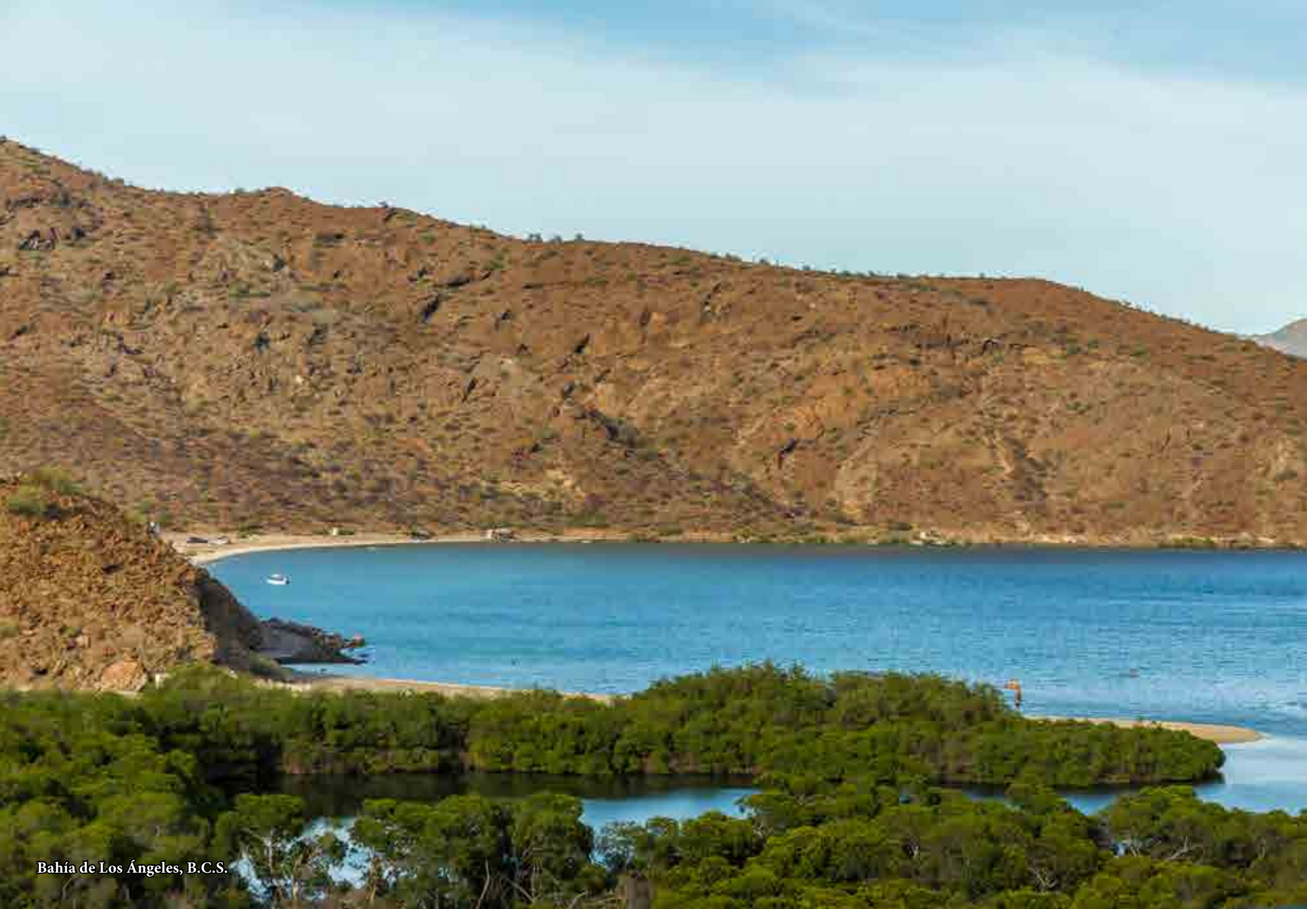
Bahía de Los Angeles, B.C.S.