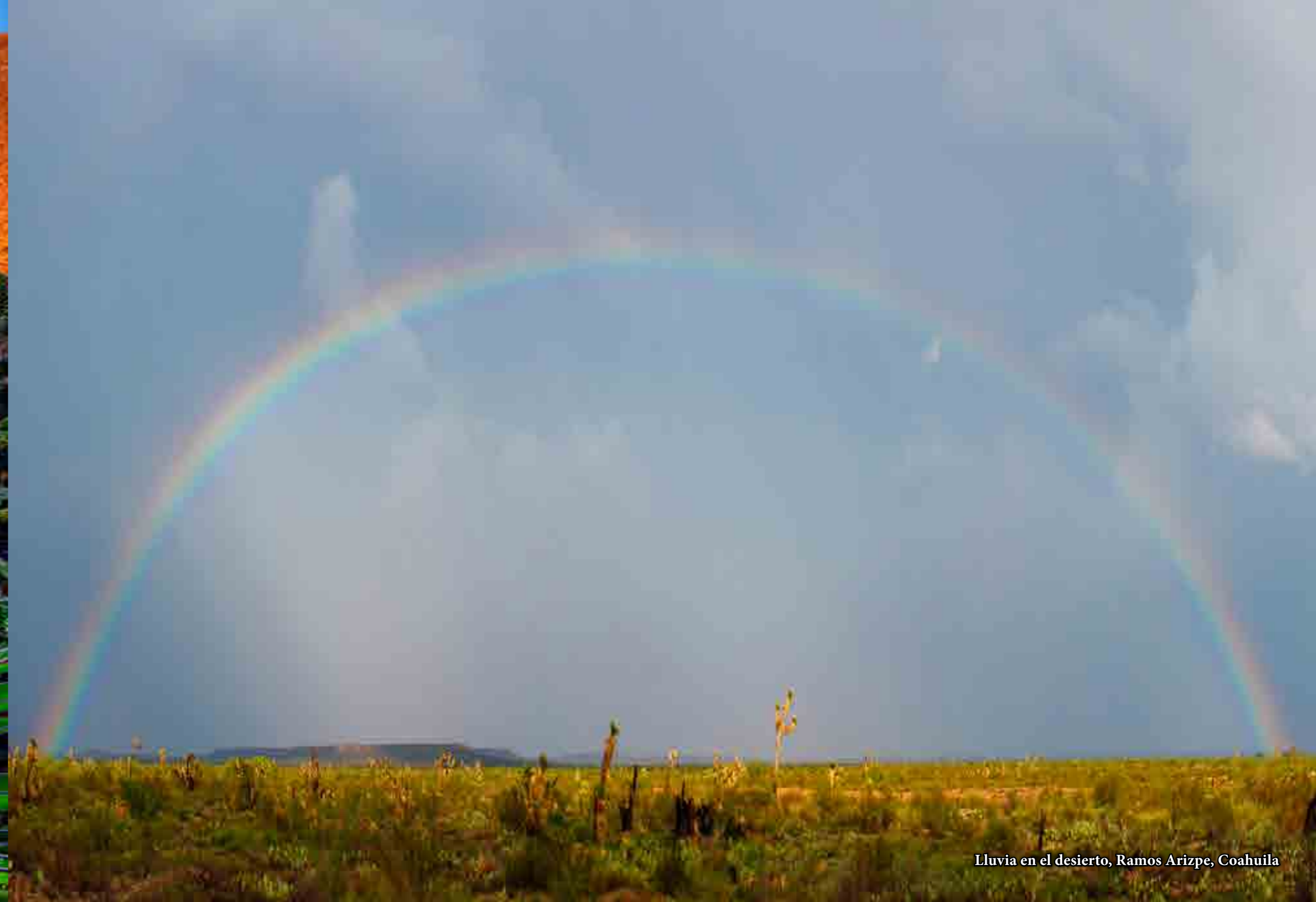
Lluvia en el desierto, Ramos Arizpe, Coahuila