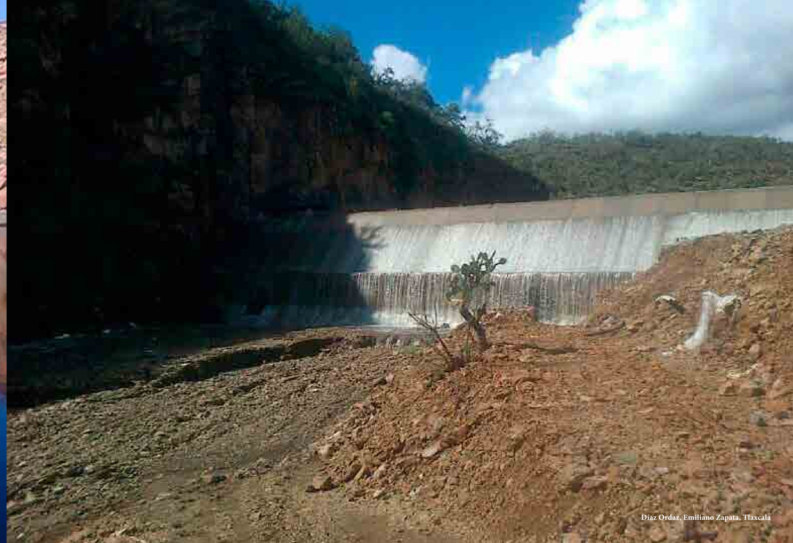
Díaz Ordaz, Emiliano Zapata, Tlaxcala