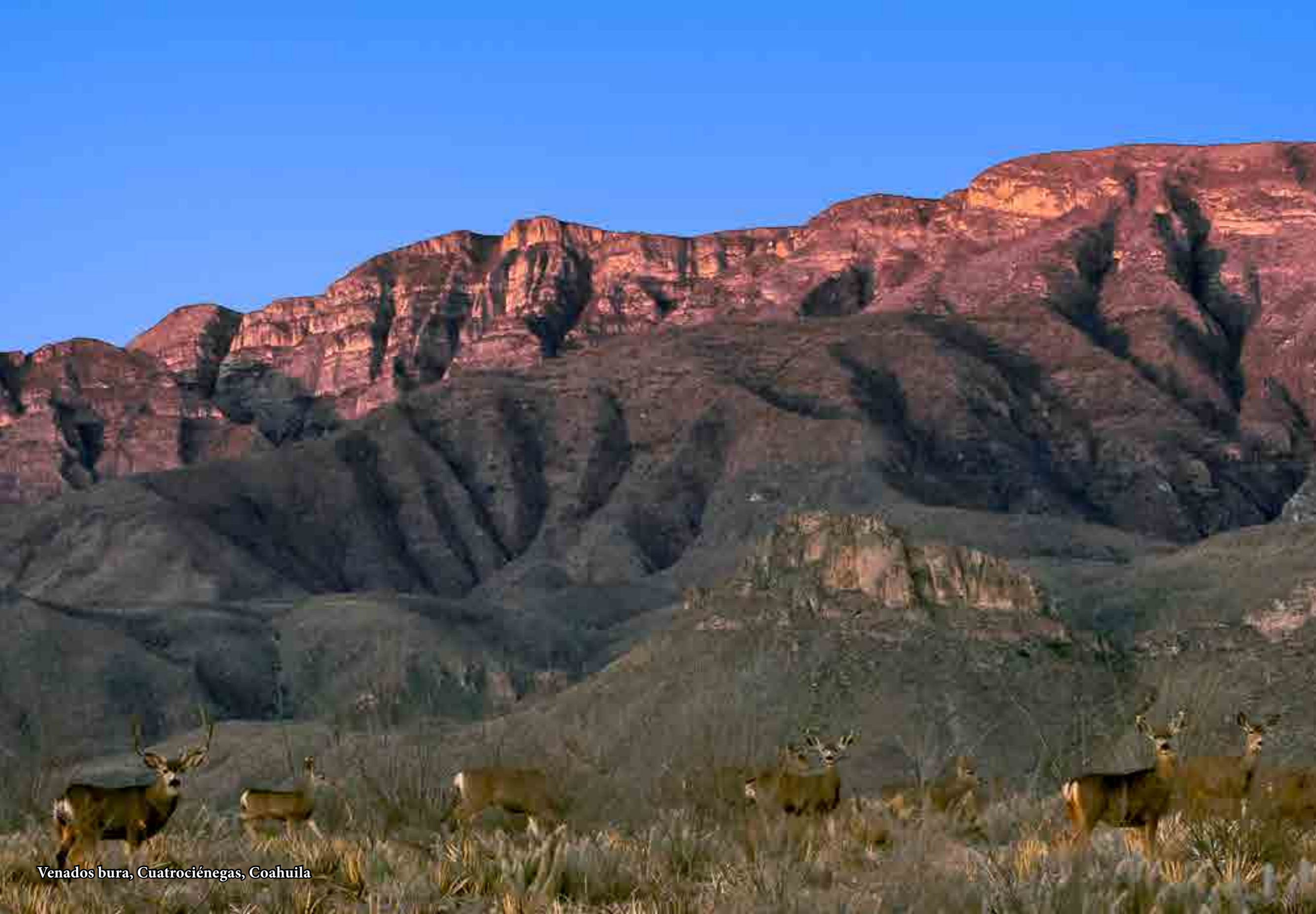
Venados bura, Cuatrociénegas, Coahuila