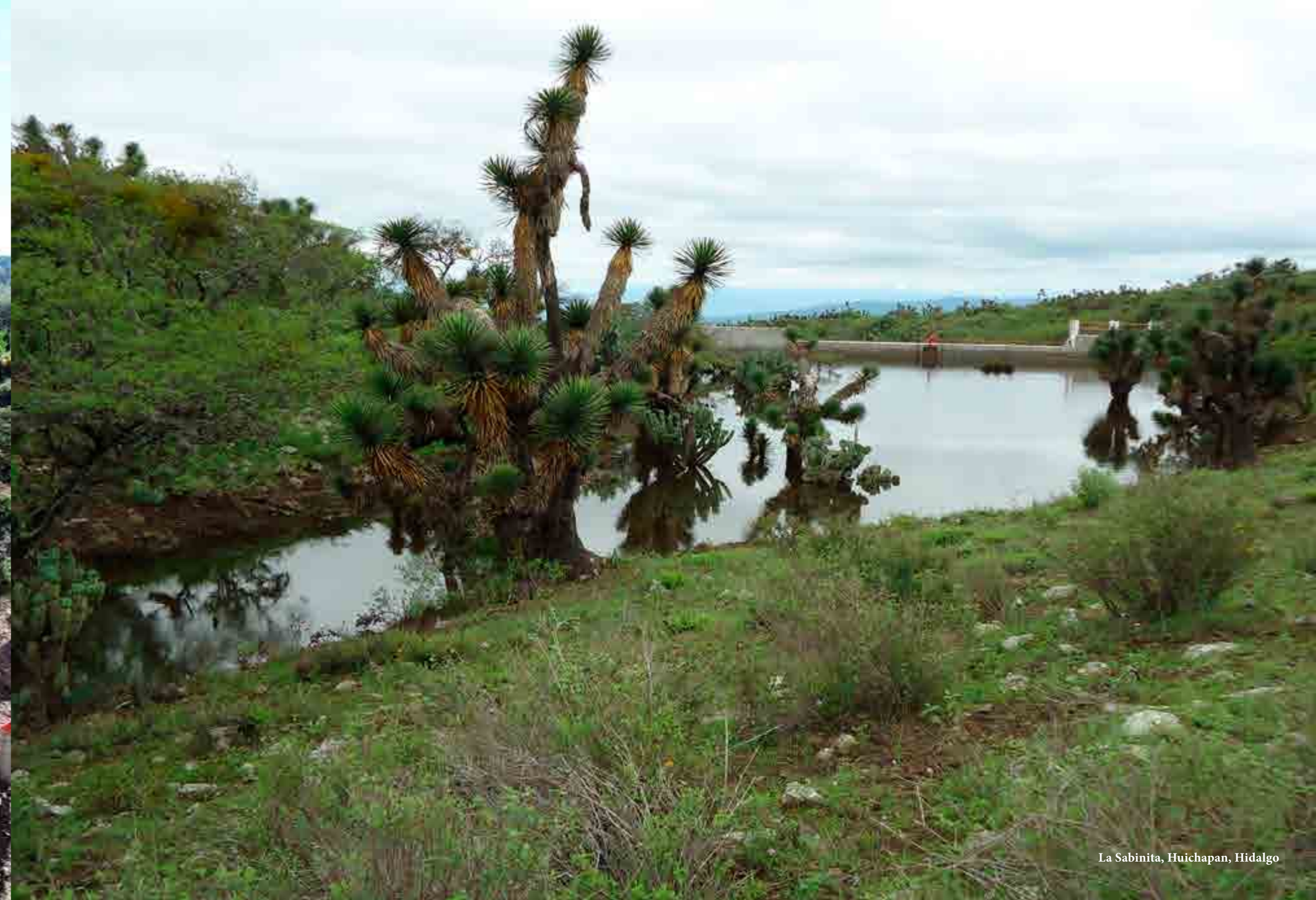
La Sabinita, Huichapan, Hidalgo