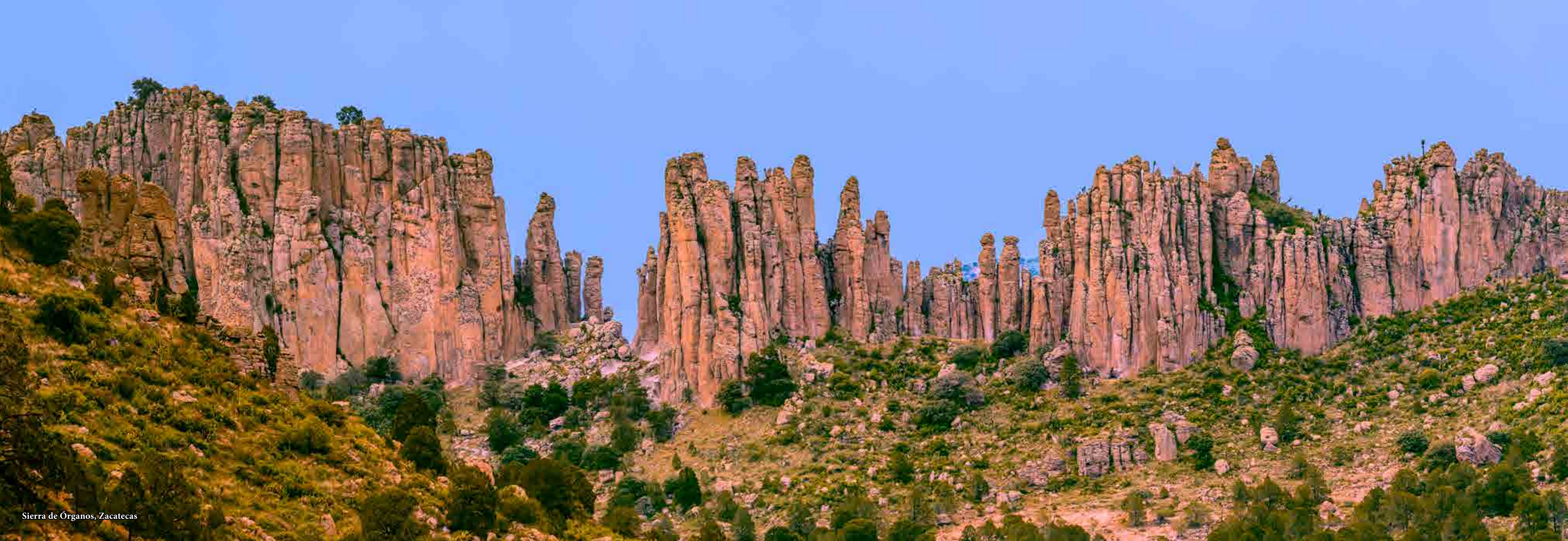
Sierra de Órganos, Zacatecas