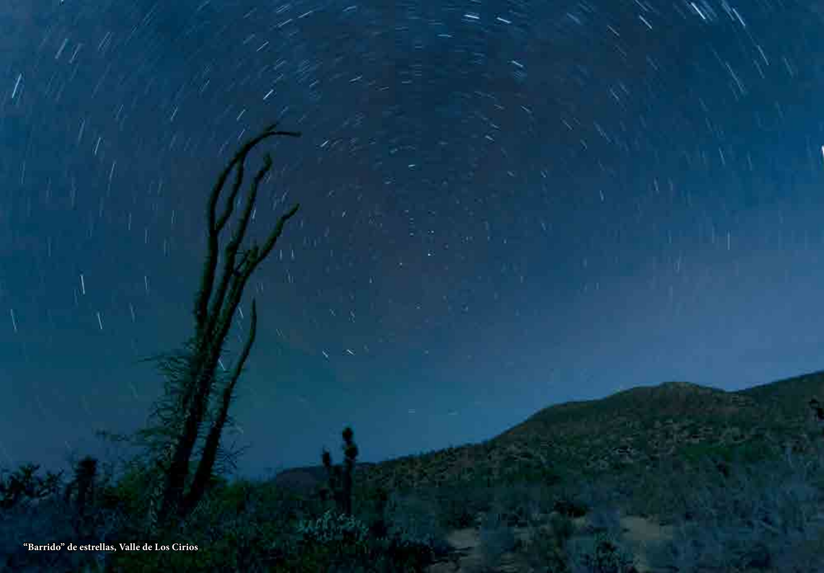
“Barrido” de estrellas, Valle de Los Cirios