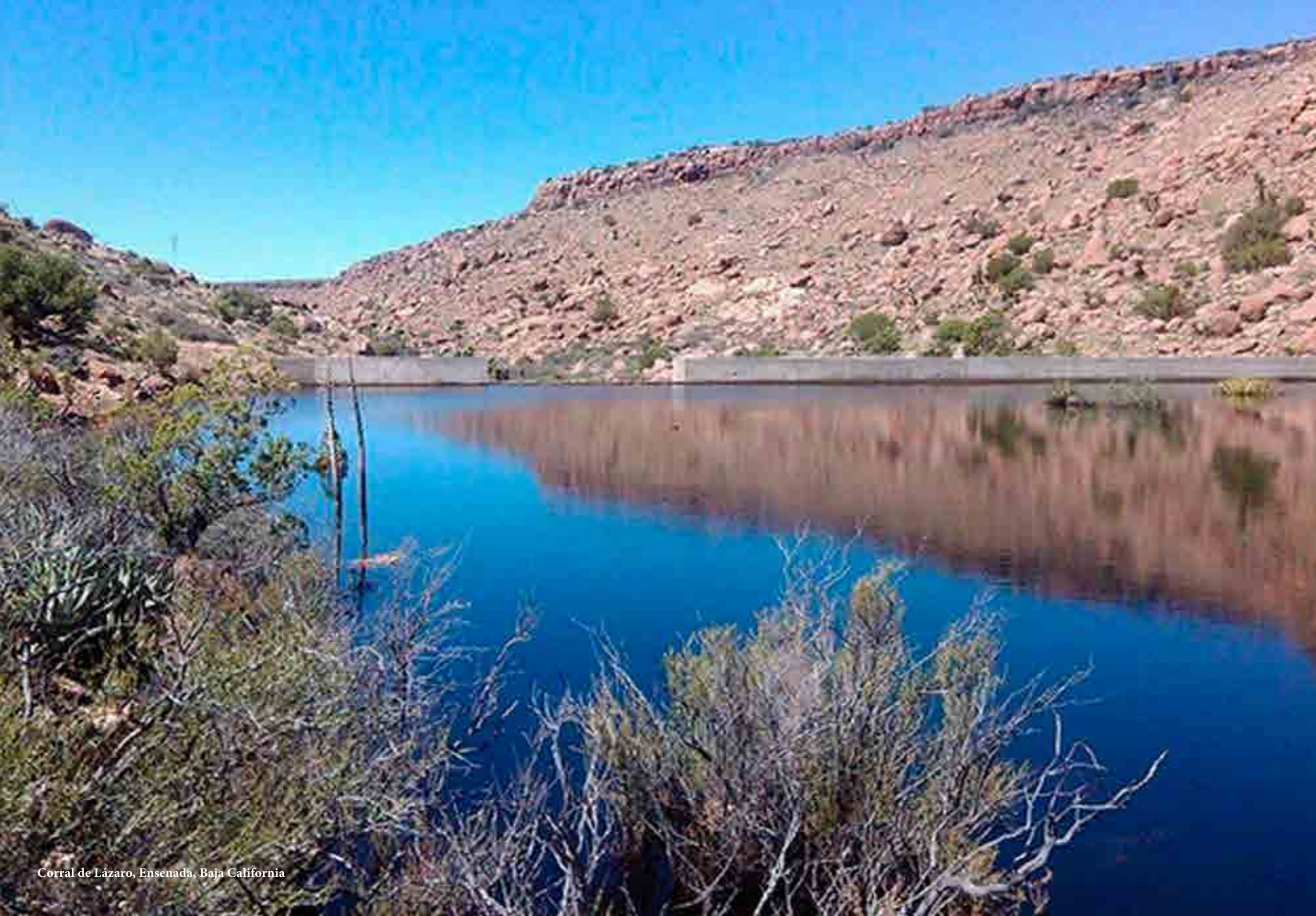
Corral de Lázaro, Ensenada, Baja California