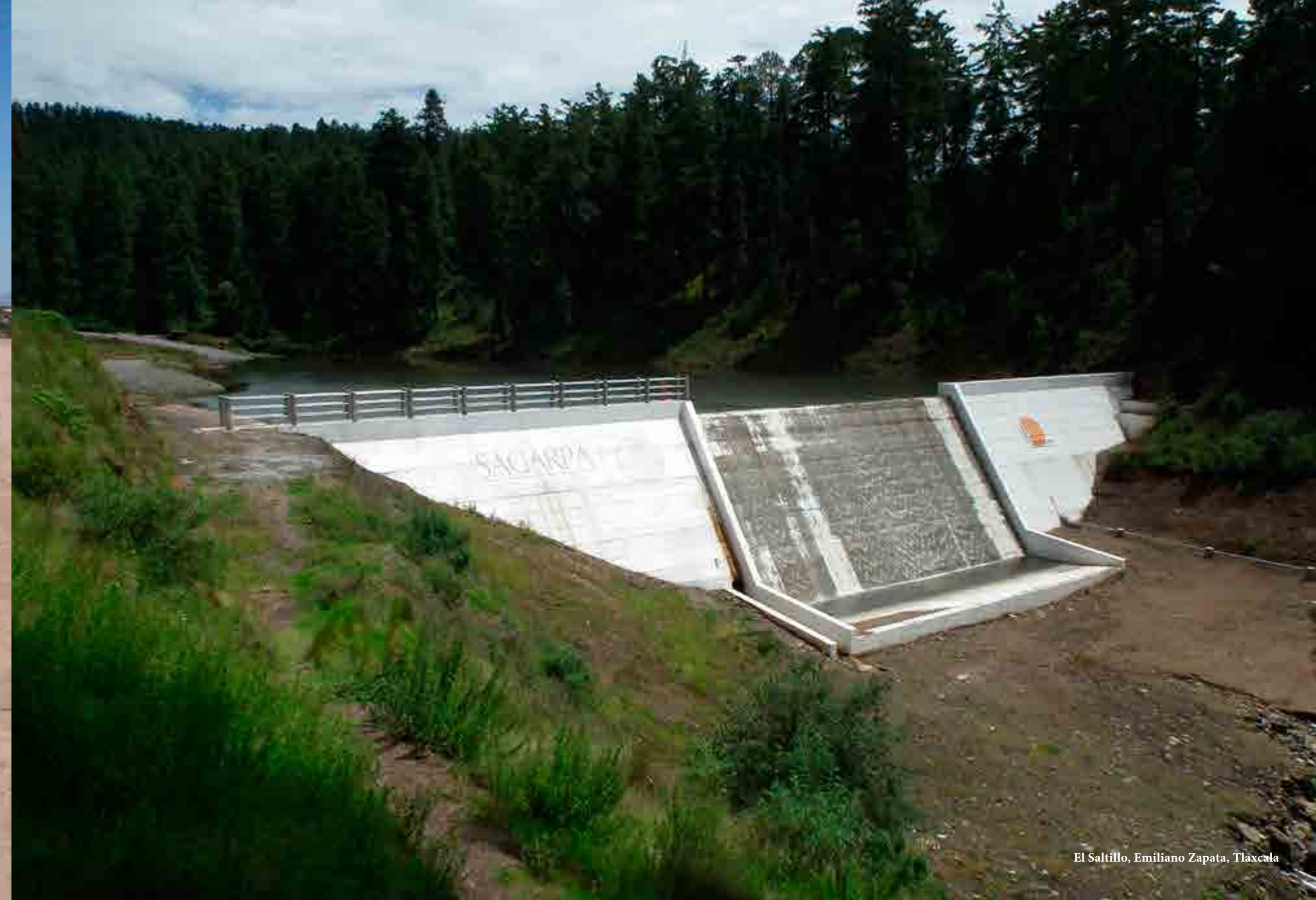
El Saltillo, Emiliano Zapata, Tlaxcala