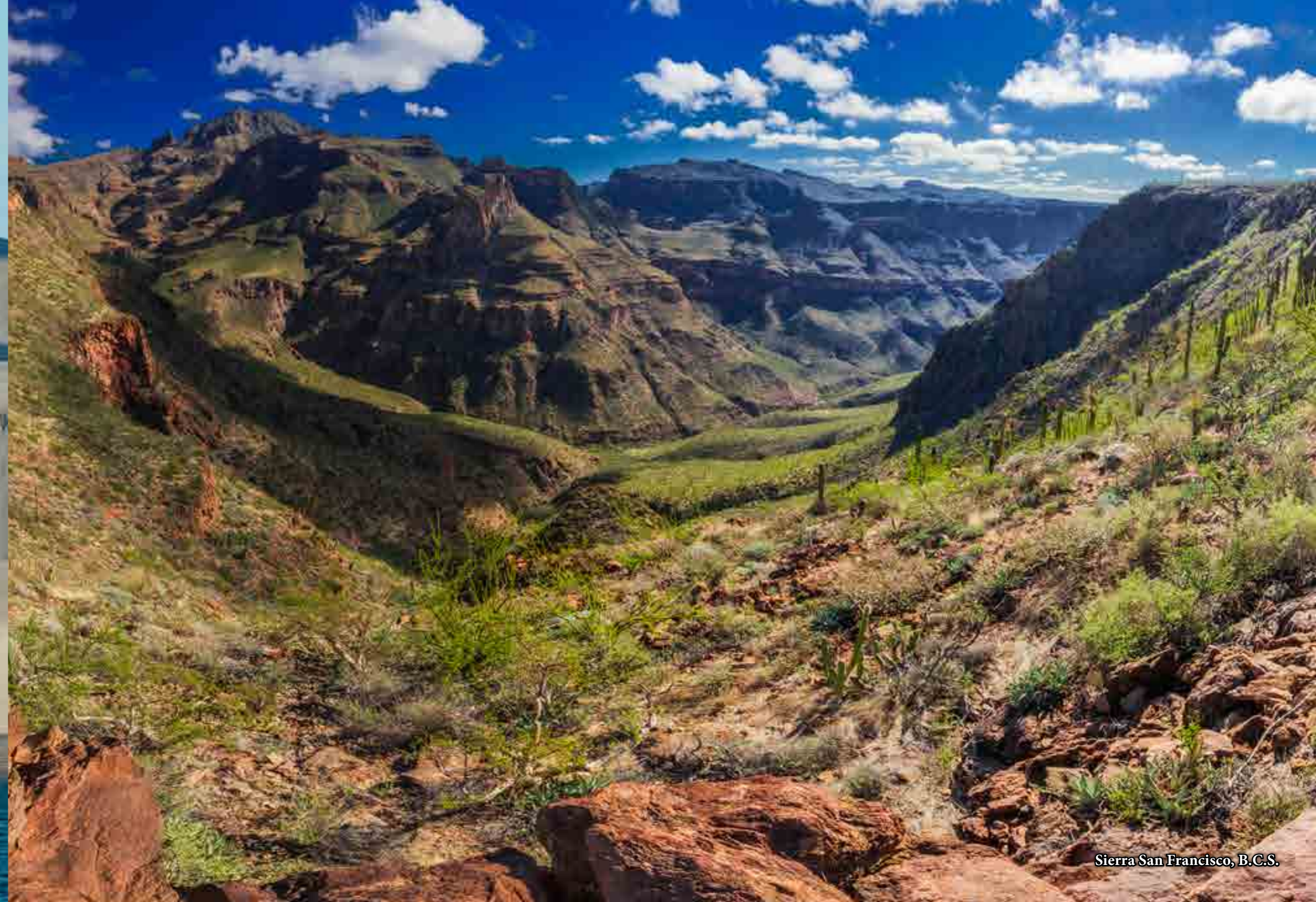
Sierra San Francisco, B.C.S.