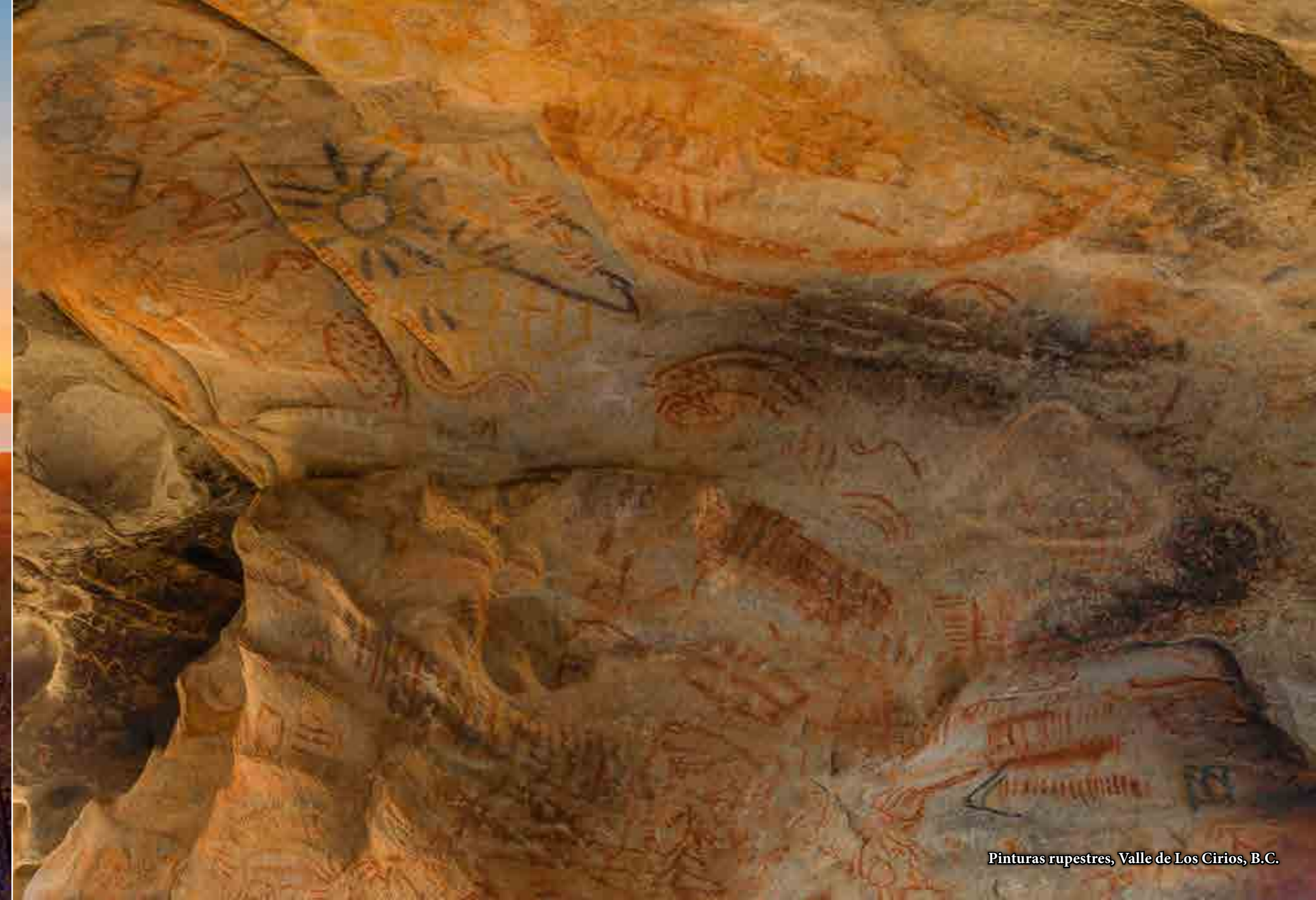
Pinturas rupestres, Valle de Los Cirios, B.C.